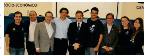
▲ Professores, dirigentes e alunos participantes no evento.