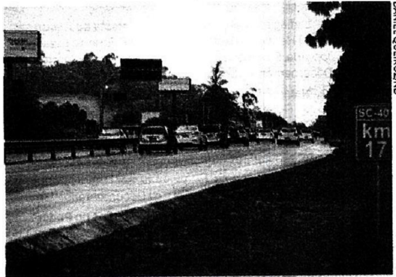
Motocicleta foi atingida na subida da SC-401 sentido Centro