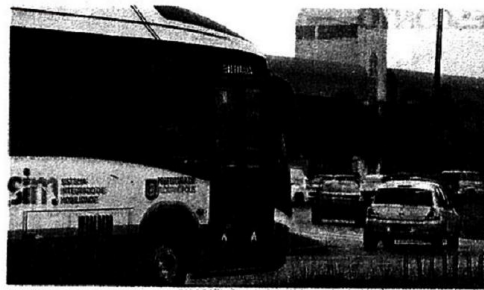
Mobilidade é um dos 137 indicadores que constam no plano de monitoramento