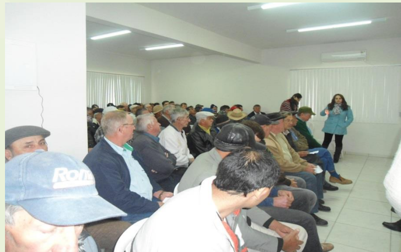
Orientação para saúde bucal.