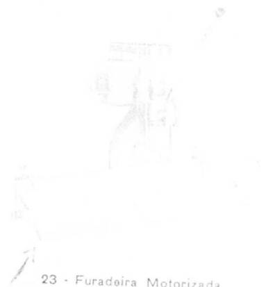
23 - Furadeira Motorizada