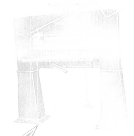
7 - Guilhotina de Alavanca 78 cm