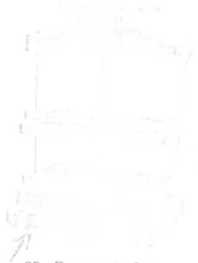
25 - Prensa de Coluna Baixa 40 cm x 50 cm