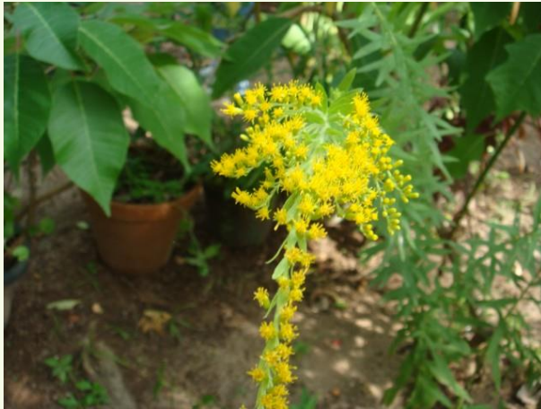
Solidago chilensis Meyen (arnica erva-lanceta)