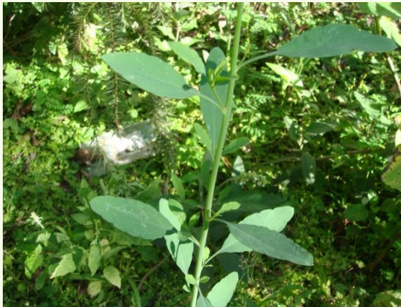
Porophyllum ruderale (Jacq.) Cass (cravinho/arnica da praia)