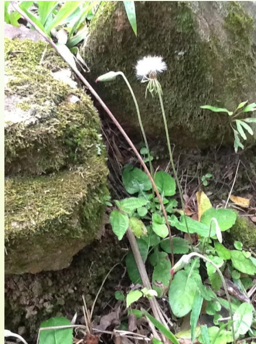
Chaptalia nutans (L.) Polak (arnica língua-de-vaca)