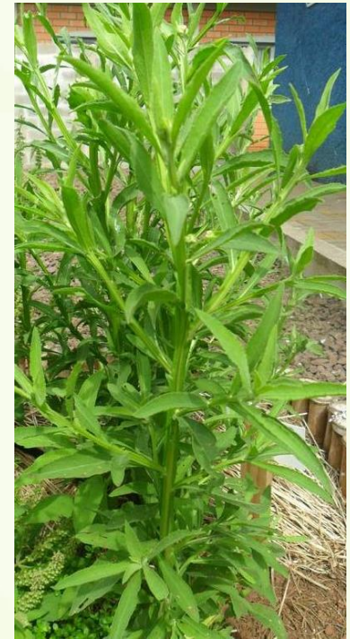
Pluchea sagittalis (quitoco, arnicon, encontrada em Presidente Castello Branco )