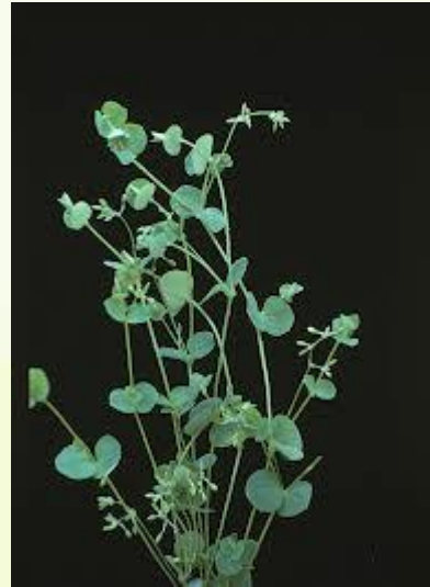
Drymaria cordata (L.) Willd. ex Schult (Mastruço-do-brejo) Para alívio da tosse, da sinusite e resfriado)