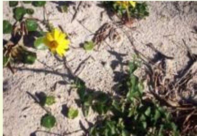
Calea uniflora Less. (arnica da praia, encontrada na região de Imbituba)