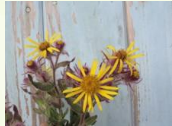
Senecio oleosus Velloz. e Senecio conyzifolius Baker (arnica da serra)