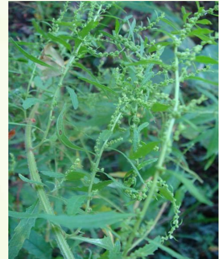
Chenopodium ambrosioides L. (mastrunço, mestruz, mastruz, erva de santa maria) Usada como anti-inflamatória no tratamento de contusões e como sabonete e xampú para pediculose e sarna)