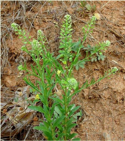
Lepidium virginicum L. (Mastruço-de-galinha) Possui usos populares semelhantes ao do mastruço-rasteiro.