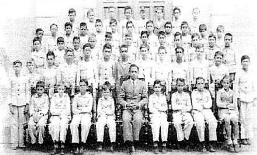
Ensino. O professor (centro) e seus alunos do curso médio em 1936