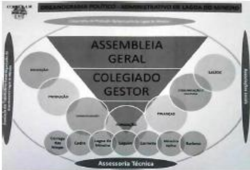
Figura 01: Estrutura organizativa do assentamento Lagoa do Mineiro

FONTE: Regimento Interno do assentamento Lagoa do Mineiro