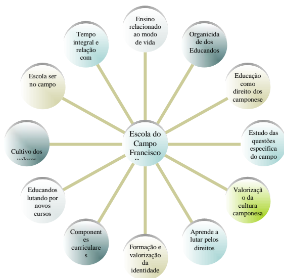
Gráfico 2. Aspectos políticos/pedagógicos da Escola do Campo.

Ao questionarmos os educandos/as sobre o que a escola do campo trazia de diferente para ampliar o conhecimento deles e se havia diferença desta escola para as demais onde tinham estudado 52 , as respostas obtidas foram sistematizadas da seguinte forma: