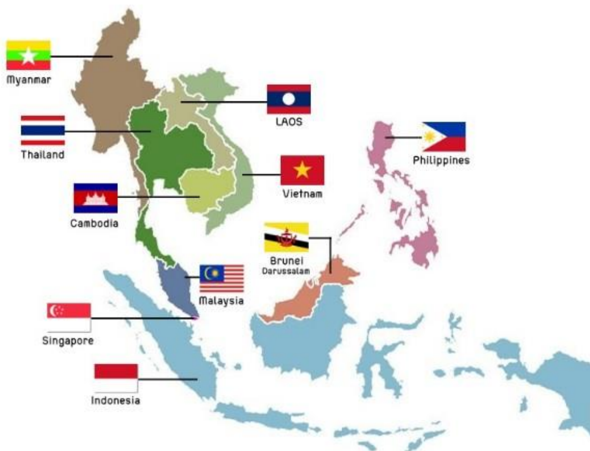
Figura 1: Países Membros da ASEAN.

Filipinas e Tailândia, aliados dos Estados Unidos durante a Guerra Fria. Em 1984, Brunei se uniu ao grupo e, nos anos 1990, Vietnam, Lao, Mianmar, Camboja passaram a integrar a Associação para cooperação na Ásia (ASEAN Secretariat, 2014). Se abrindo, assim, para países socialistas. Essa integração conta com dez parceiros- Austrália, Canadá, China, Índia, Japão, Rússia, Nova Zelândia, Coreia do Sul, Estados Unidos da América e União Europeia.