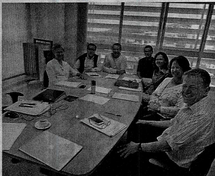
Diretoria do sindicato reunida: construindo uma entidade inovadora e mais atuante