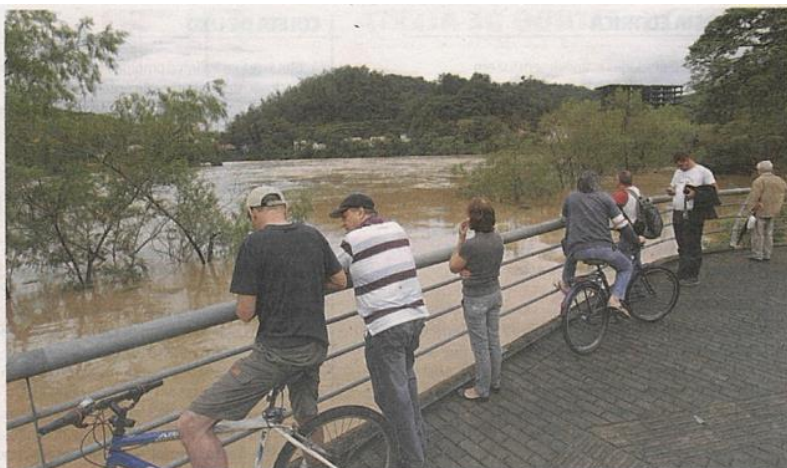
Dezenas de pessoas acompanharam de perto ontem o aumento do nível do rio Itajaí-Açu, no Centro de Blumenau

Atendimentos nos hospitais Santo Antônio, Santa Isabel e Misericórdia foram cancelados. So-