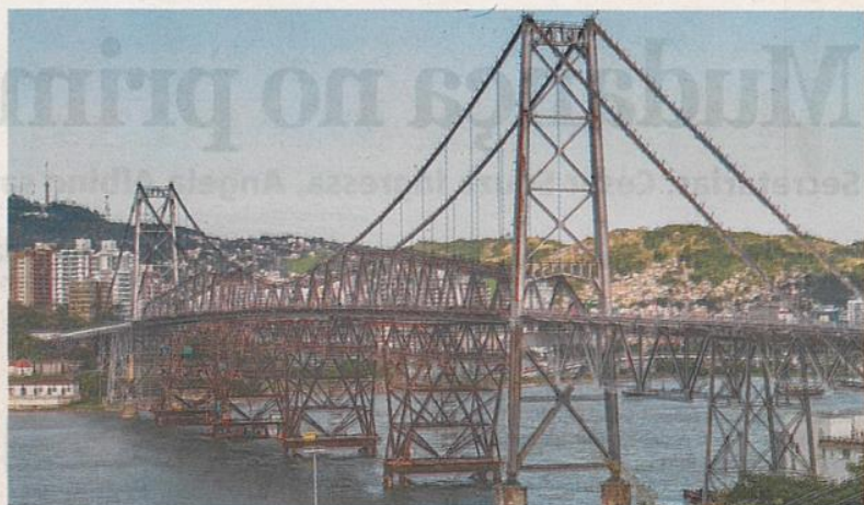
Restauração. Preocupados com o futuro da Hercílio Luz, engenheiros dizem que faltam informações sobre a obra

veira, essa comissão nunca foi criada e deveria reunir entidades como Crea, Fiesc, UFSC, OAB/SC, Alesc e o município. "Queremos pedir ao governo a reativação desta comissão para convocar as partes interessadas para ter uma solução, que seja recuperar a ponte ou construir outra, mas tudo dentro do que está estabelecido na questão do patrimônio histórico. Estamos muito preocupados e agora estamos ainda mais empenhados em dar uma solução a esta ponte", afirmou.