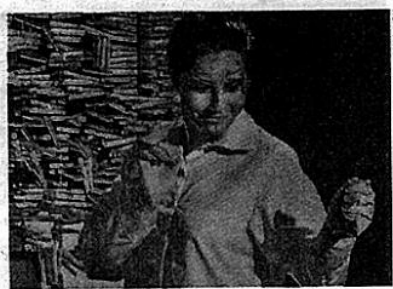
No Teatro Sesc Prainha. "Todos (os que) caem", na sexta, às 20h