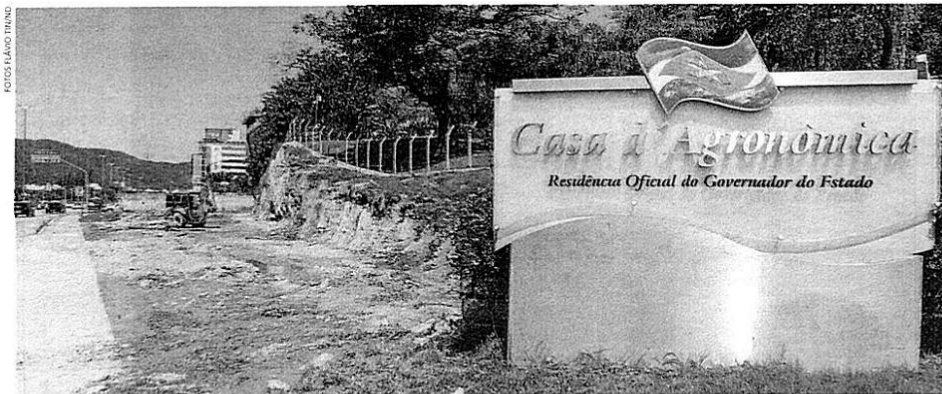
Nova pista. Parte de uma grande rocha em frente à casa do governador foi destruída