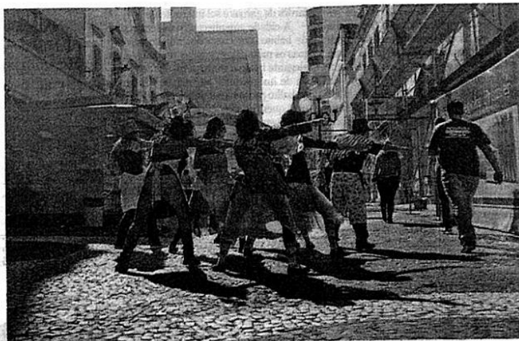
Espectáculo "Oitava-feira decretamos feriado", do Grupo ETC, da Udesc, será apresentado hoje, às 17h, no Ticen