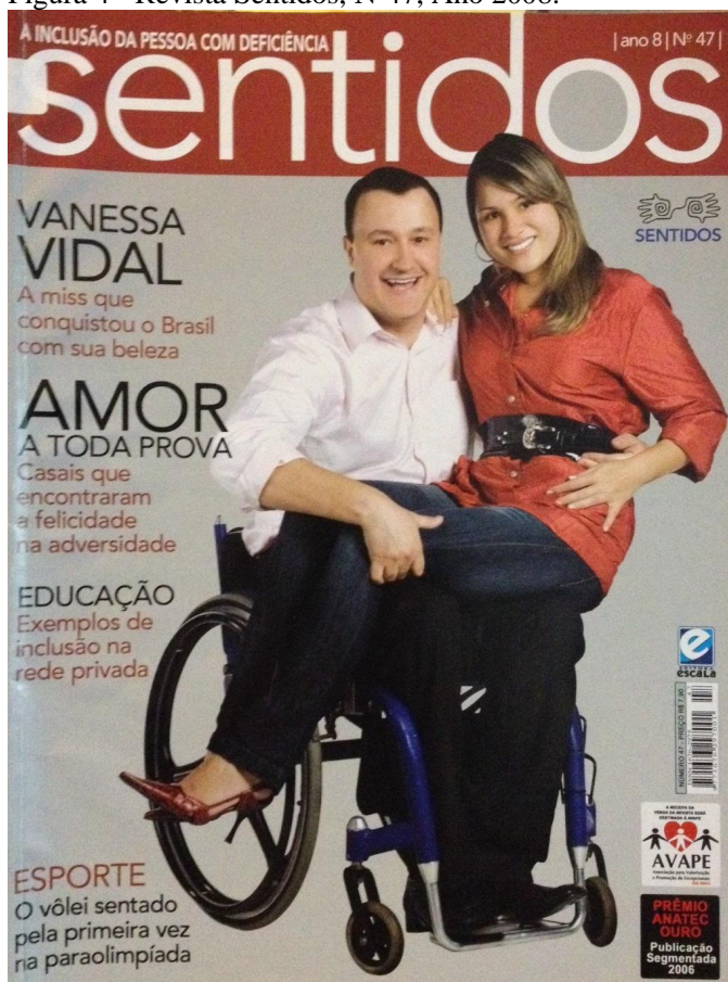
Figura 4 - Revista Sentidos, Nº47, Ano 2008.

O enquadramento desta imagem está em plano conjunto, o que nos permite observar a cadeira de rodas de um dos personagens retratados e ambos de corpo inteiro. A retórica visual correspondente à imagem é realista, pois, ao mesmo tempo em que marca a deficiência apresentando-a, nos aproxima das pessoas retratadas, nos identificamos por estarem fazendo algo trivial: sendo um casal. No entanto, ao nos determos no texto, vemos dois pontos interessantes. O primeiro deles está relacionado ao título da chamada que diz “ Amor à toda prova ” e, em seguida, “ felicidade na adversidade ” que evocam a ideia de que