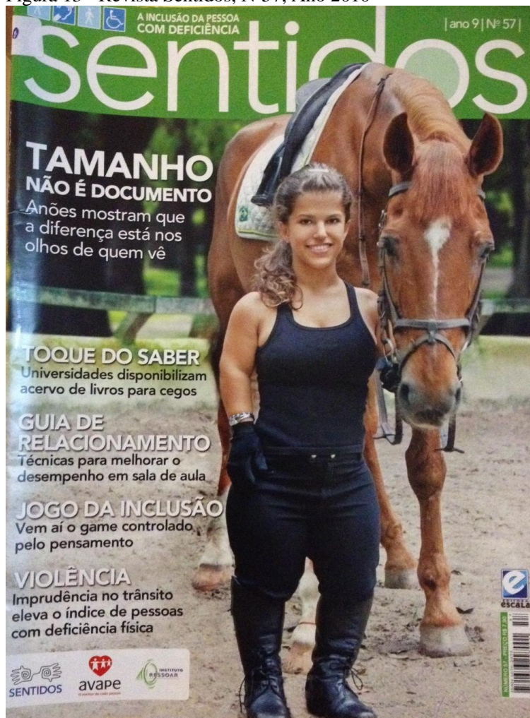
Figura 13 - Revista Sentidos, N°57, Ano 2010