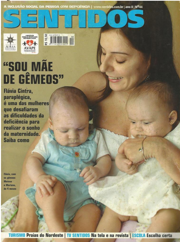
Figura1- Revista Sentidos Nº 44 - Ano 2008

Desde o início de suas publicações até meados de 2008 – ano em que a revista mudou da Editora Áurea para a Escala –, a Sentidos possuía uma capa bastante “limpa”, constituída pela imagem e chamada da matéria principal e de algumas palavras que sintetizavam as outras