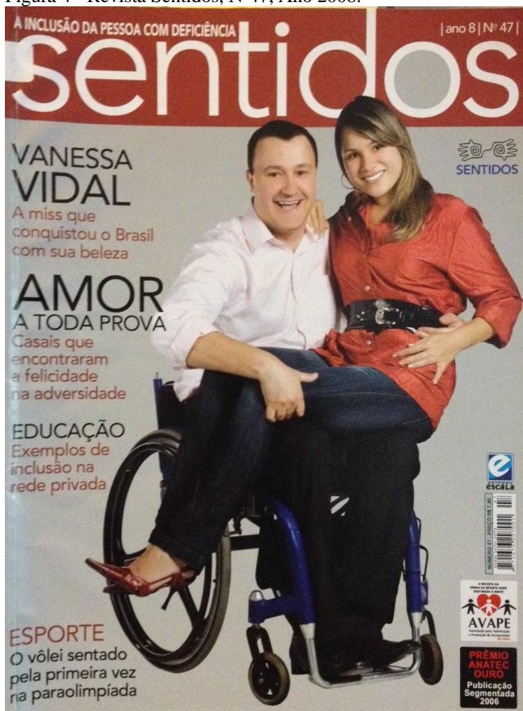
Figura 4 - Revista Sentidos, Nº47, Ano 2008.

Com essa grande mudança editorial, consequentemente, suas capas sofreram transformações. A primeira edição feita pela Escala, a de número 47 (foto acima), por exemplo, traz uma capa com outro layout : muito mais colorida e composta de chamadas com títulos e textos um pouco mais explicativos. Nessa edição, a imagem retrata um homem numa cadeira de rodas e há uma mulher sentada no colo dele. A