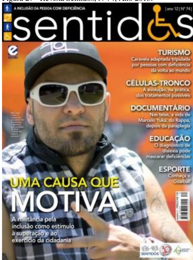
Figura 27 - Revista Sentidos, N°74, Ano 2013.

Ao lançar uma primeira observação em direção à edição 74, pouco se pode aprofundar em relação à imagem. Porém, ao direcionar atenção ao texto, vemos o quanto essa capa é interessante. Isso porque o texto traz a ideia de que lutar pelos direitos das pessoas com deficiência é “ uma causa que motiva ”, como se esse grupo social fosse digno da compaixão de pessoas motivadas pela “ causa ”. Em seguida, o texto afirma que “ a militância pela inclusão ” serve de “ estímulo à superação ”, como se o fato de pessoas com deficiência assumirem seu papel de ativistas as fizessem superar algo. Outra constatação que