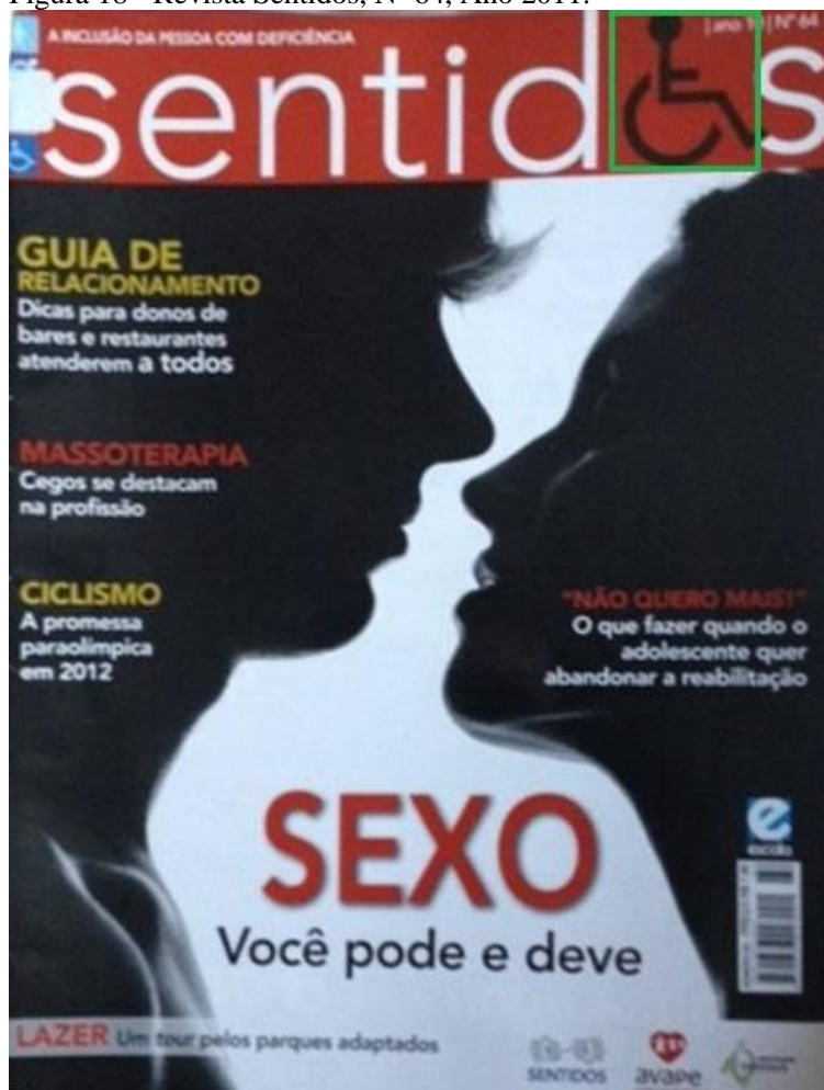
Figura 18 - Revista Sentidos, Nº 64, Ano 2011.