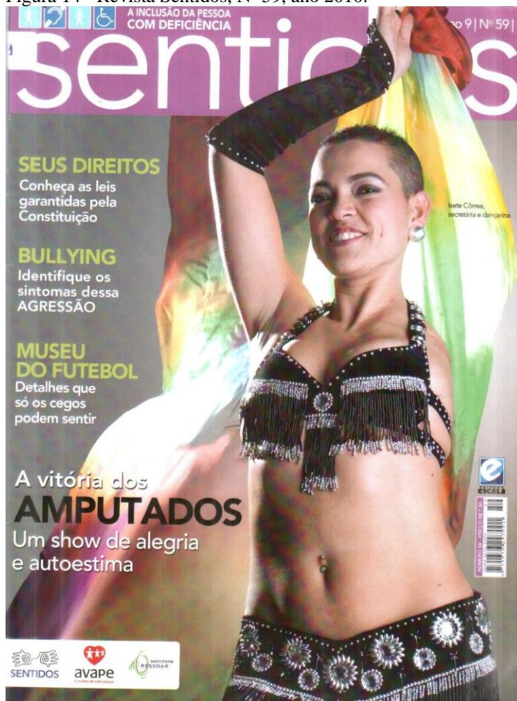
Figura 14 - Revista Sentidos, Nº 59, ano 2010.

Na capa 59 a imagem é de uma mulher sem o braço esquerdo trajando roupa de dança do ventre 17 e com um lenço na mão direita. Seu