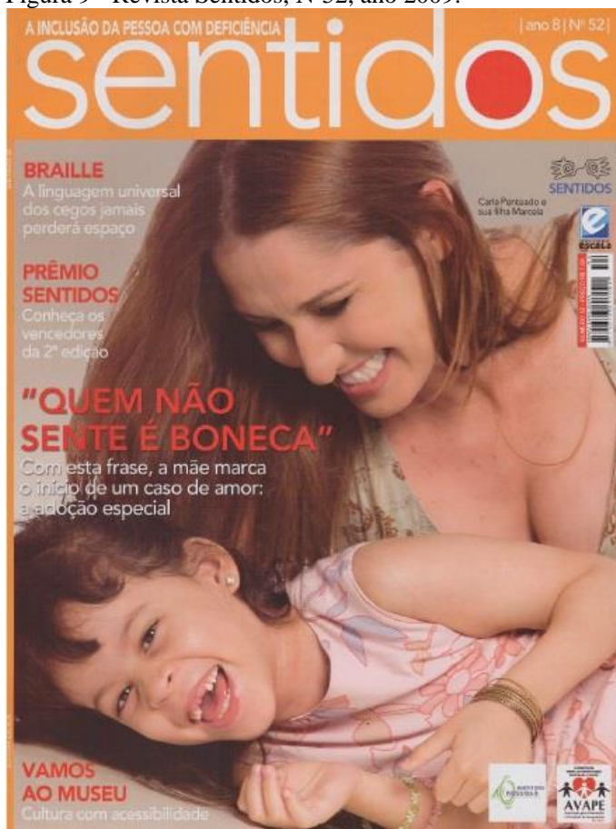
Figura 9 - Revista Sentidos, Nº52, ano 2009.

A imagem da capa 52 retrata uma mulher olhando para baixo com uma criança no colo. Ambas sorriem, parecendo um momento de muita descontração. A chamada da matéria de capa diz: “‘ QUEM NÃO SENTE É BONECA ’. Com esta frase, a mãe marca o início de um caso de amor: a adoção especial.”.