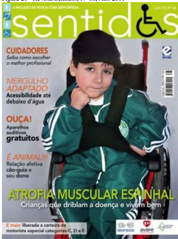
Figura 20 - Revista Sentidos, Nº 66, Ano 2011

A edição 66 aborda o tema da saúde. Na imagem há um menino cadeirante vestindo o uniforme do Palmeiras 21 . O texto referente à