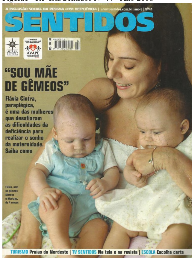
Figura1 - Revista Sentidos Nº 44 - Ano 2008

As capas que evocam o tema família são as de números 44, 49 e 52.