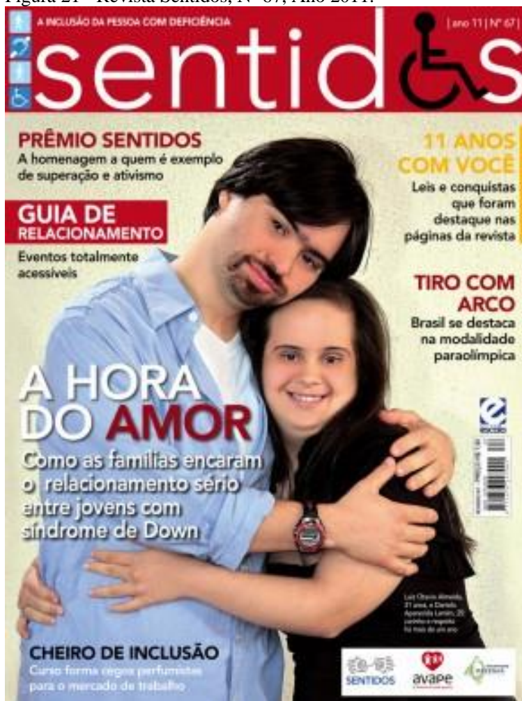
Figura 21 - Revista Sentidos, Nº 67, Ano 2011.

Na imagem da capa da edição 67, aparece um casal heterossexual de pessoas Síndrome de Down abraçado. Ambos são jovens e a chamada escrita referente à matéria da capa diz: " A HORA DO AMOR: como as famílias encaram o relacionamento sério entre jovens com Síndrome de Down. ".