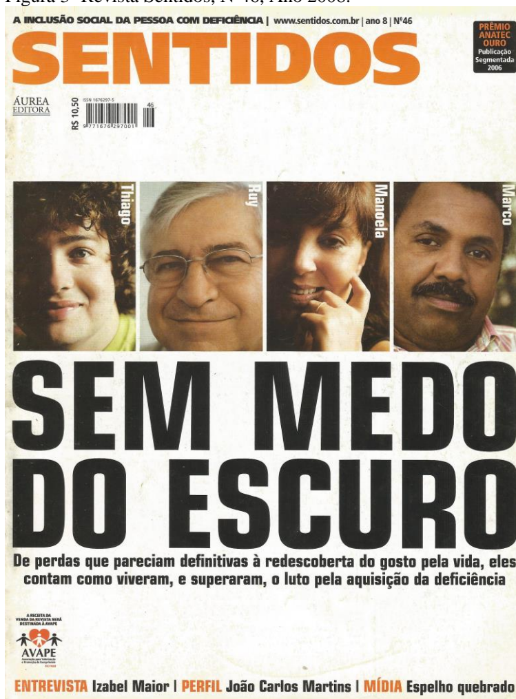
Figura 3- Revista Sentidos, Nº46, Ano 2008.

Ainda em 2008, outras duas edições da revista foram publicadas sob responsabilidade da Editora Áurea, as de números 45 e 46. A partir dessas publicações, a revista passou a ser um produto da Editora Escala com o objetivo de tornar-se um meio de comunicação entre as pessoas com deficiência em todo o território nacional, vendido por internet e em bancas, dando maior visibilidade ao tema. Vale mencionar que o valor