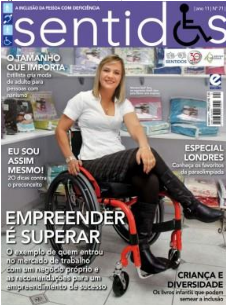
Figura 24 - Revista Sentidos, Nº 71, Ano 2012.

A edição 71 retrata uma mulher sorrindo e sentada em uma cadeira de rodas dentro, aparentemente, de uma loja. O texto da chamada diz: “EMPREENDER É SUPERAR. O exemplo de quem entrou no mercado de trabalho com um negócio próprio e as recomendações para um empreendimento de sucesso.” .