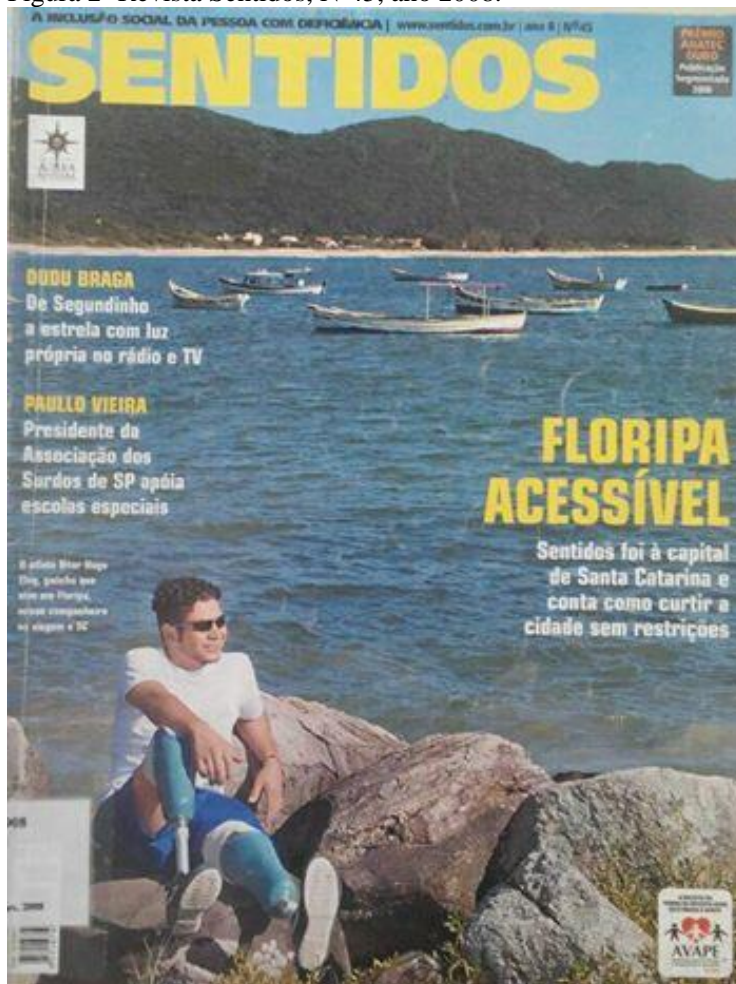
Figura 2- Revista Sentidos, Nº45, ano 2008.

A edição 45 traz o lazer como tema de capa. Nela, há um rapaz com próteses nas pernas sentado em algumas pedras. Ao fundo, vemos o mar com alguns barcos. O rapaz parece admirar a paisagem. O texto diz: “FLORIPA ACESSÍVEL. Sentidos foi à capital de Santa Catarina e conta como curtir a cidade sem restrições.”