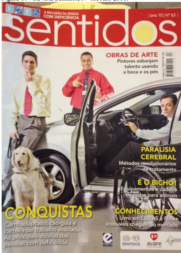
Figura 17 - Revista Sentidos, Nº 63, Ano 2011.

A conquista de direitos pelas pessoas com deficiência é o tema principal da edição 63. Na imagem aparece metade de um carro com a