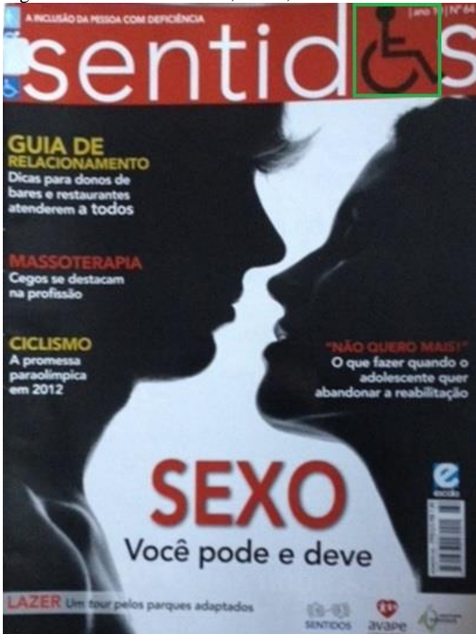
Figura 18 - Revista Sentidos, Nº 64, Ano 2011.

No caso das capas analisadas, percebe-se o quanto os textos se justapõem às imagens. Na edição 64, embora o texto diga que “ SEXO: você pode e deve ”, a imagem em close-up e escura possibilita uma interpretação contrária: que é algo obscuro, velado e sem dar visibilidade à deficiência. Na edição 67, por sua vez, embora a imagem mostre nitidamente um casal com Síndrome de Down, o texto fala do amor trazendo as famílias como sujeitos principais da matéria, dando, portanto, margem à ideia de que pessoas com deficiência, principalmente a intelectual, são meras coadjuvantes, pessoas