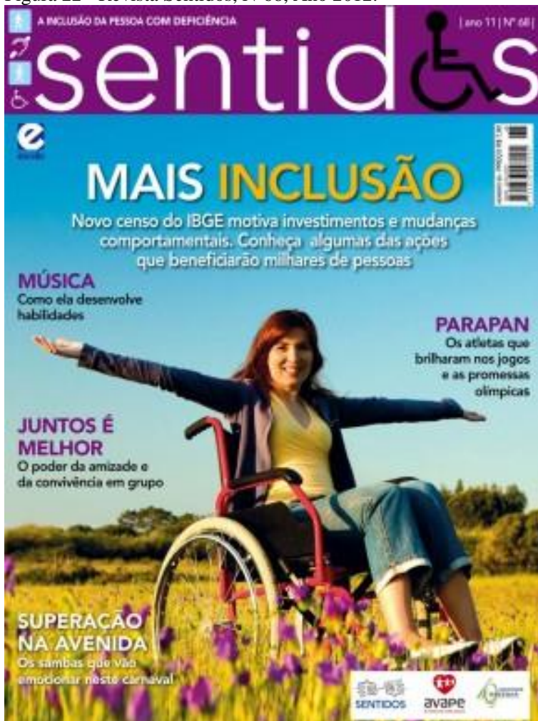
Figura 22 - Revista Sentidos, Nº68, Ano 2012.

A edição 68 traz em sua capa a cidadania como tema principal. A imagem é composta por uma mulher cadeirante, de braços abertos e sorrindo no meio de uma plantação de flores. O texto referente à