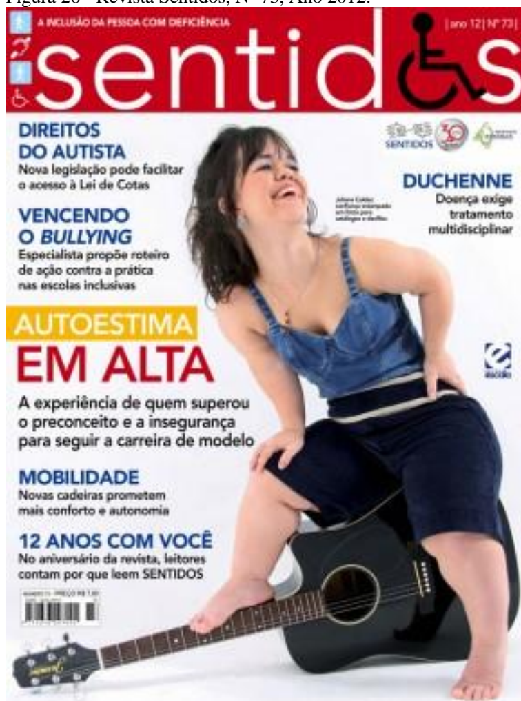
Figura 26 - Revista Sentidos, Nº 73, Ano 2012.

A edição 73 traz uma mulher com nanismo sentada em cima de um violão e sorrindo. O assunto de capa é a autoestima, cujo texto diz: “AUTOESTIMA EM ALTA. A experiência de quem superou o preconceito e a insegurança para seguir a carreira de modelo.”