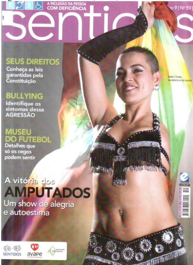
Figura 14 - Revista Sentidos, Nº 59, ano 2010.

Nessa capa, vemos um enquadramento dos joelhos para cima, o que nos permite constatar a deficiência da mulher fotografada: a amputação do braço esquerdo. Entretanto, a chamada de capa é bastante interessante e parece andar na contramão. Quando o texto diz “ a vitória dos amputados: um show de alegria e autoestima ” nos remete à ideia de que os amputados são vencedores por serem alegres e altivos como se a amputação, necessariamente, implicasse em tristeza e baixa autoestima. E o que estão vencendo, afinal? Além disso, apesar de estar retratada