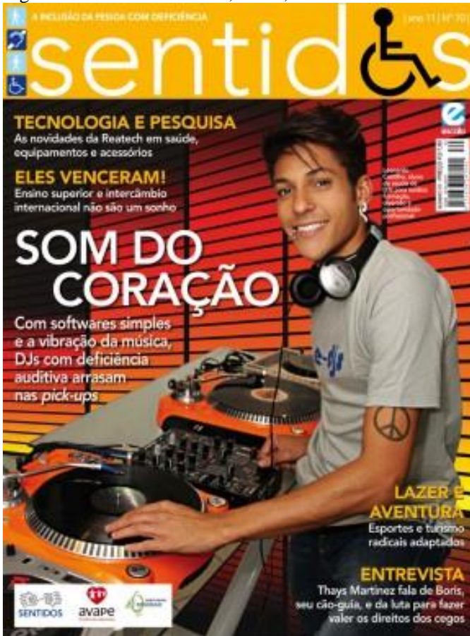
Figura 23 - Revista Sentidos, Nº 70, Ano 2012.

Na capa de número 70, um jovem rapaz sorri e aparenta mexer em um equipamento de som, nos moldes de uma mesa para DJ. O texto referente à imagem diz: “ SOM DO CORAÇÃO. Com softwares simples e a vibração da música, DJs com deficiência auditiva arrasam nas pick-ups. ”.