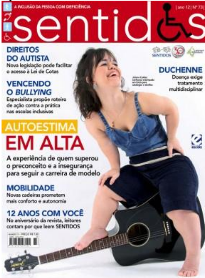
Figura 26 - Revista Sentidos, Nº 73, Ano 2012.

A primeira parte do texto faz um trocadilho com o fato de a personagem retratada ser anã: “ autoestima EM ALTA ” com letras maiúsculas. Em seguida, a chamada revela que a personagem “ superou o preconceito e a insegurança para seguir a carreira de modelo ” como se fosse possível extinguir definitivamente o preconceito em dias atuais. Quando a frase refere-se à superação da insegurança para modelar, vemos que até pouco tempo era improvável que uma pessoa com deficiência pudesse seguir carreira de modelo. A autora Garland-Thomson (2001) versa sobre essa possibilidade quando cita a retórica