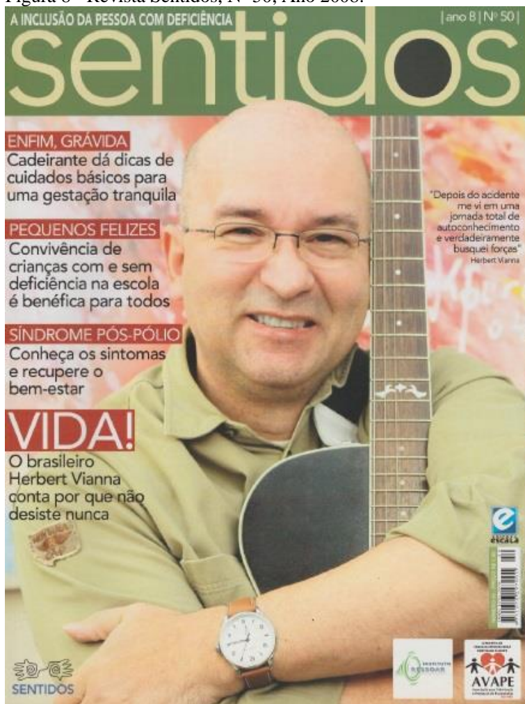
Figura 8 - Revista Sentidos, Nº 50, Ano 2008.

Na publicação seguinte, a de número 50, a reportagem de capa retrata um homem sorrindo e segurando um violão. Como o enquadramento da imagem é da metade do abdome para cima, apenas é possível afirmar ser um homem com deficiência por se tratar do cantor