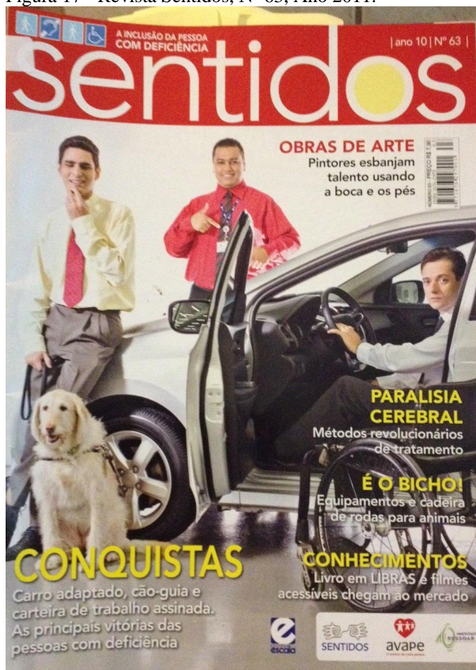
Figura 17 - Revista Sentidos, Nº 63, Ano 2011.

Na edição 63, a imagem ilustra metade de um carro com a porta aberta, um homem sentado no banco do motorista e uma cadeira de rodas próxima à porta. Mais a frente, encostado no capô, há um homem segurando um cão-guia e, um pouco mais atrás, do outro lado do carro, um homem com um crachá aponta para o carro. A chamada da matéria diz: “ CONQUISTAS. Carro adaptado, cão-guia e carteira de trabalho assinada. As principais vitórias das pessoas com deficiência. ”.