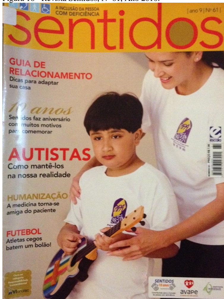
Figura 16 - Revista Sentidos, Nº 61, Ano 2010.

A capa 61 tem o autismo 19 como assunto em destaque. Na imagem há uma mulher sorrindo atrás de um menino e o apoiando com