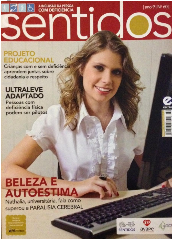
Figura 15 - Revista Sentidos, Nº60, Ano 2010.