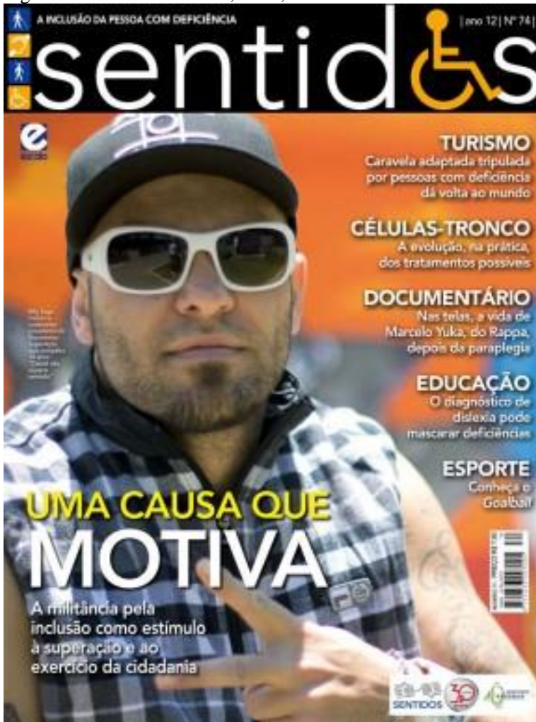
Figura 27 - Revista Sentidos, Nº74, Ano 2013.