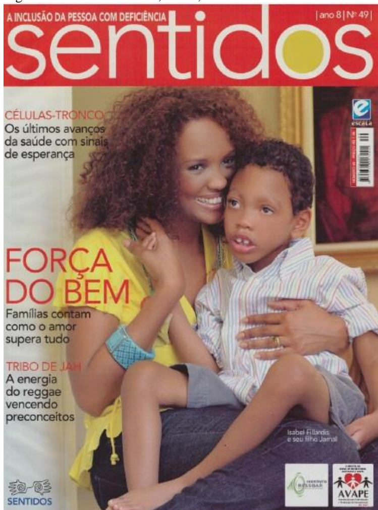
Figura 7 - Revista Sentidos, Nº 49, ano 2008.

Na edição de número 49, a capa traz uma imagem de uma mulher, a atriz Isabel Fillardis 14 , sorrindo com uma criança (um menino)