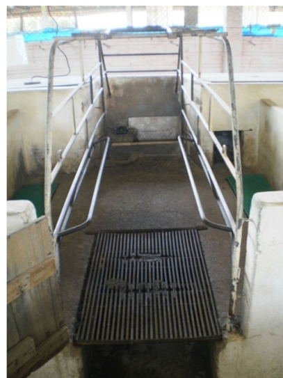
Figura 4 Ilustração da gaiola das salas 2 a 5