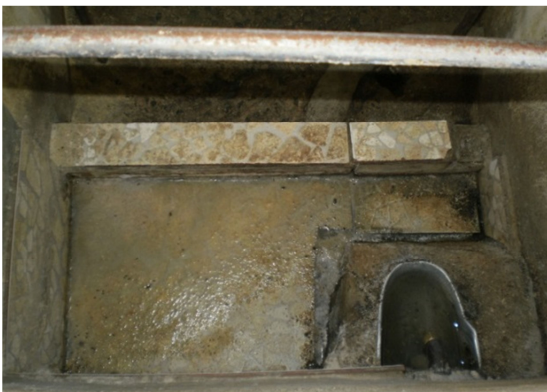
Figura 3 Comedouro das gaiolas das salas 2 a 5