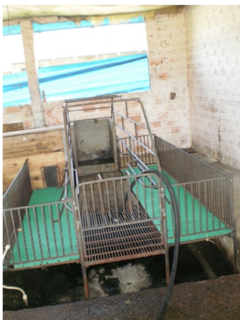
Figura 6 Ilustração da gaiola da sala 1

A formulação da ração lactação utilizada durante o experimento é apresentada na Tabela 5.