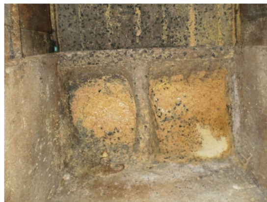
Figura 5 Comedouro das gaiolas da sala 1