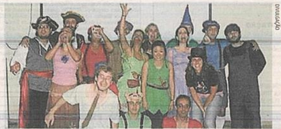
Alguns dos professores que participam do Projeto Integrar em Florianópolis

Ao ingressar na universidade, eles ainda contam com parceria dos veteranos, que são convidados