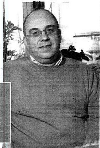
Medeiros: Entre o poema, a prosa e o texto teatral