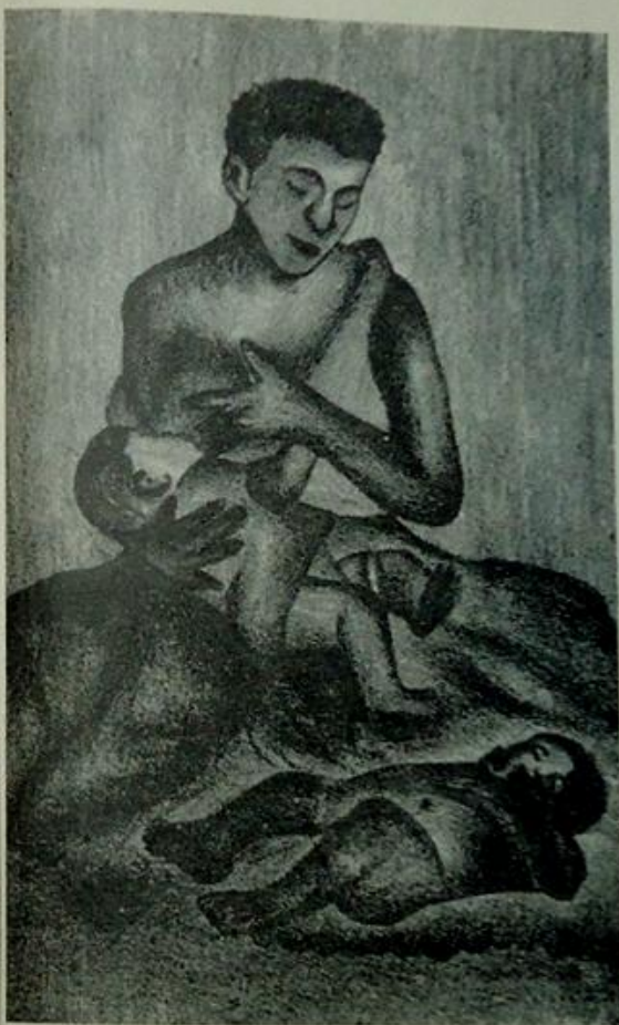
De A Canção do Africano