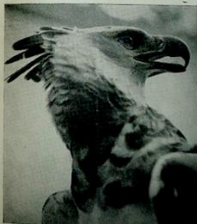
GAVIÃO REAL ( Thra saetus harpya ) adquirido em Boa Vista para o Zoológico do Parque Educativo de Goiânia.

Os Waicás comemoram uma festa que denominam FESTA DA TROCA, reunião para troca de objetos entre si. Iniciam as festividades da seguinte maneira: Dois homens (primeiro os chefes) se abraçam, apertando-se com toda força; seguindo-se até sentar abraçando. O mais resistente fará a troca mais vantajosa. Durante os acontecimentos,