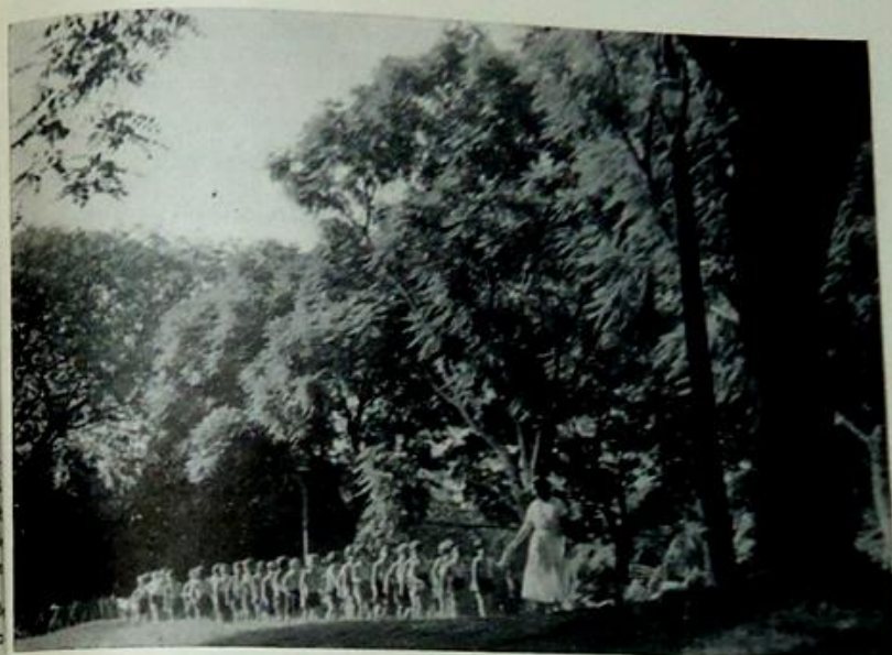
Aspecto de uma excursão promovida pela Divisão de Educação, Assistência e Recreio da Prefeitura Municipal de São Paulo

ESPECIAL cuidado merece o Setor de Educação Física. Vasta área é reservada a crianças e aparelhos para recreação. Isso em cada Parque ou Recreio.