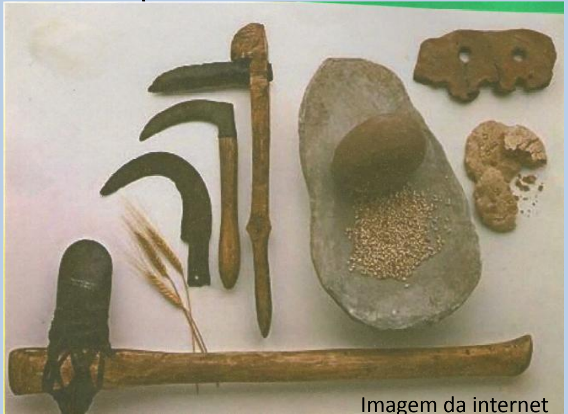
Imagem da internet