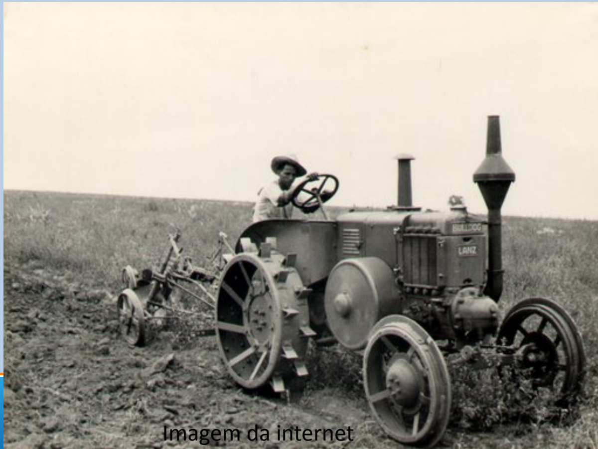
Imagem da internet