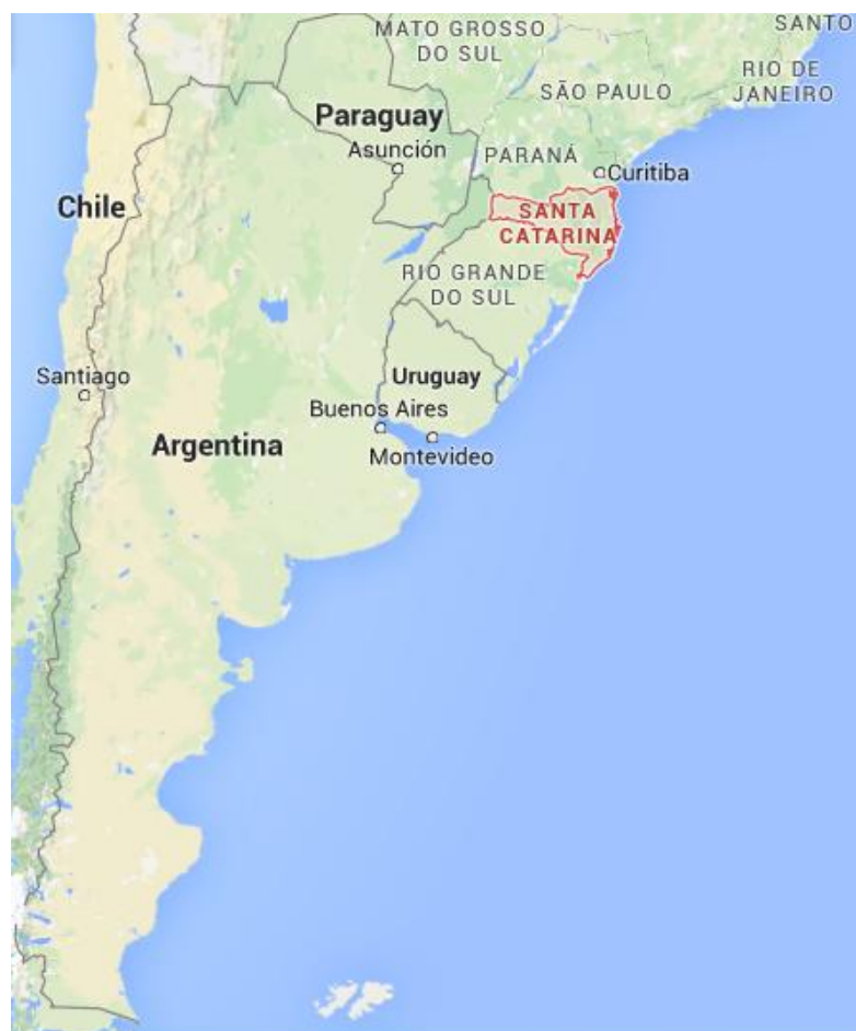
Figura 1: Mapa de Santa Catarina e Mercosul