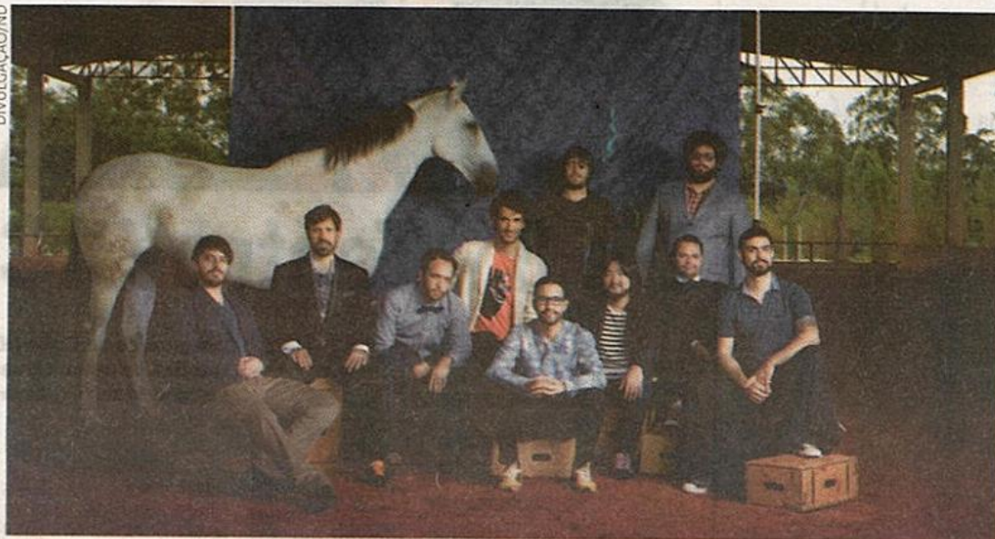
Programação. O grupo brasileiro Móveis Coloniais de Acaju está na agenda de música do festival da UFSC