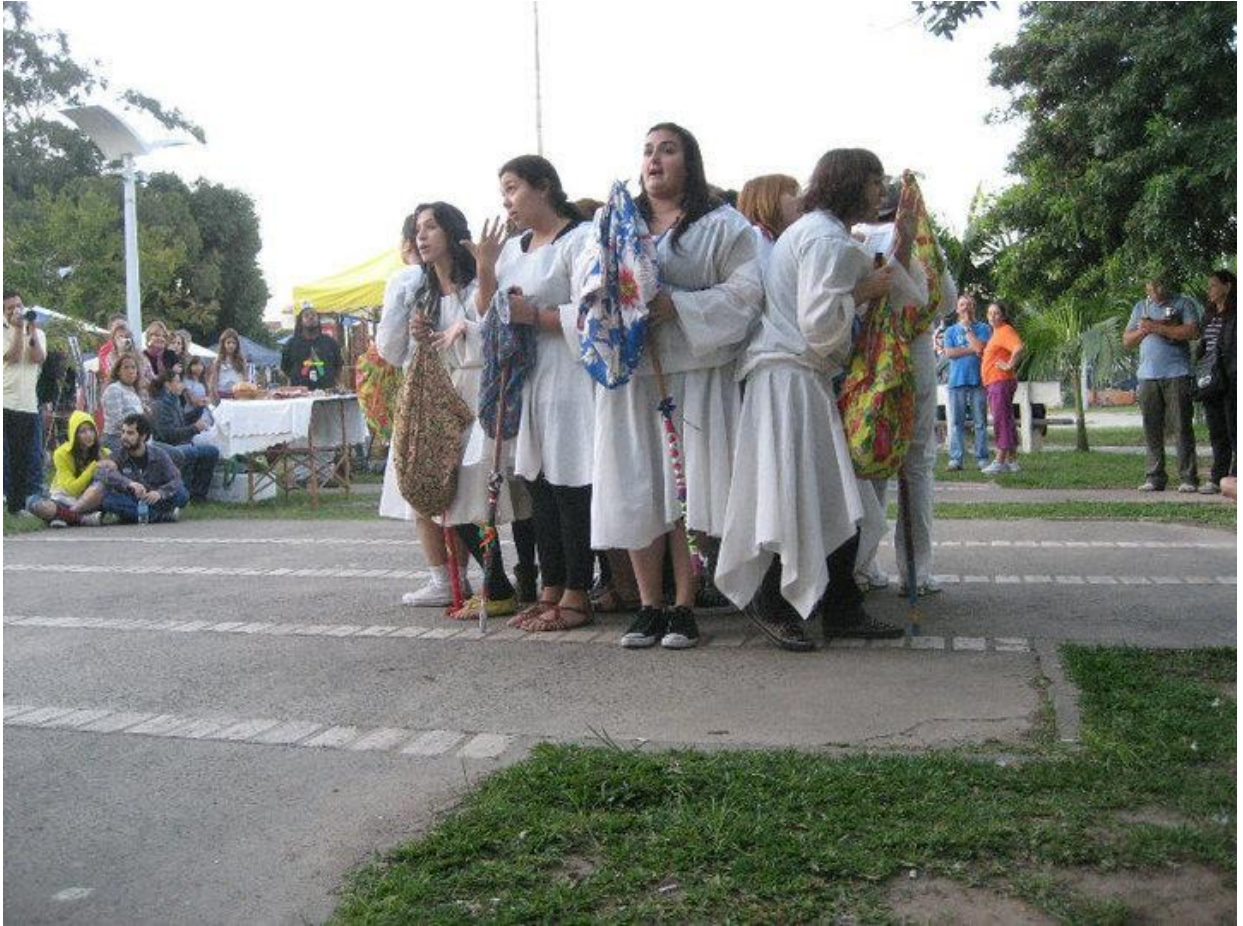
Apresentação de Migrante Carcará na Lagoa da Conceição, em Florianópolis, 2010.