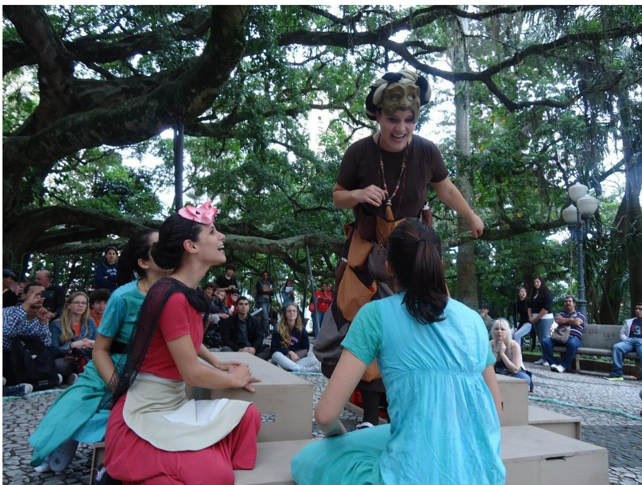
A estreia oficial na Praça XV de Novembro. Florianópolis, 2011. Acervo do grupo.

A apresentação ocorreu muito bem, conseguimos nos divertir, brincar com o público, improvisar, enfim, tudo muito melhor do que o planejado. Estávamos orgulhosas de nosso trabalho, com um sentimento de dever cumprido e alegria de poder compartilhar este momento com tantas pessoas queridas. No entanto, sabíamos que era só o começo do caminho: havia ainda mais nove apresentações a serem realizadas pelo projeto.