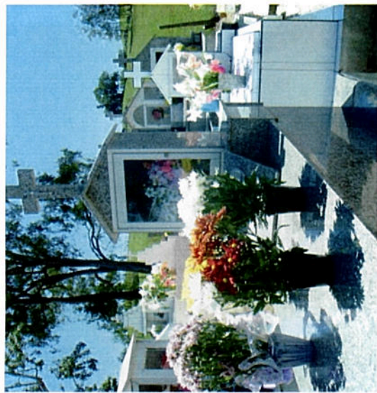
Foto 09 -Cemitério católico de São Tomaz no dia de finados em 2009 – detalhe das flores naturais