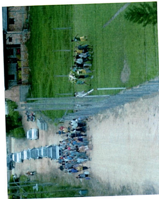
Fotos 12 – Enterro de Ícaro no momento que passa pelo campo de futebol