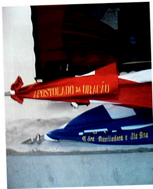
Foto 11 – Bandeiras da Congregação Mariana (Azul) e do Apostolado da Oração (vermelha)