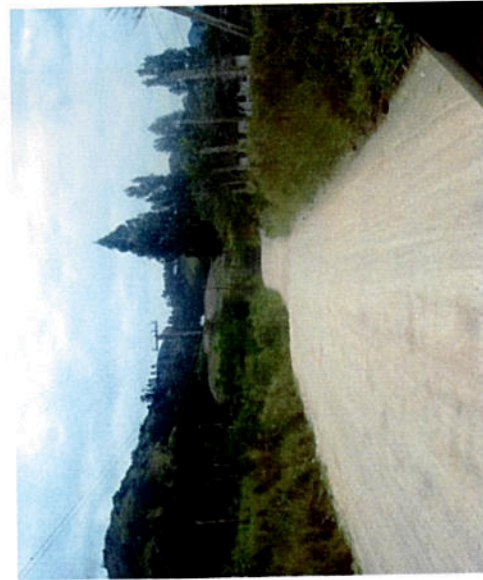
Foto 08 – vista fora do centro do bairro onde podemos ver a distância entre as casas