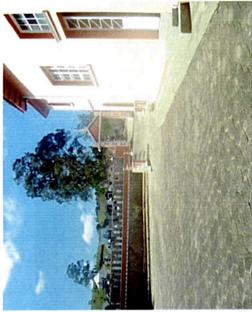
Foto 05 - Entrada principal do cemitério católico