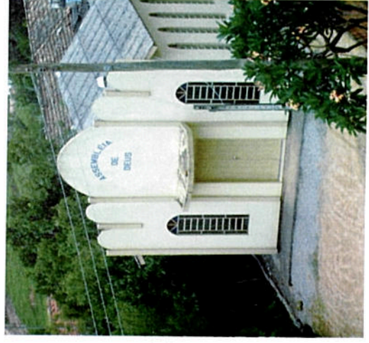
Foto 02 - Assembleia de Deus do sul