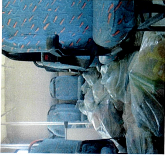
Foto 01 - Transporte de alimentos feito no ônibus de linha