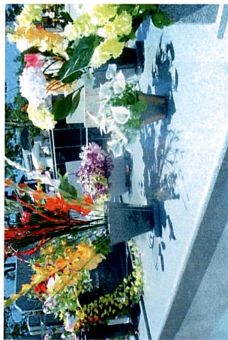
Foto 10- Cemitério católico de São Tomaz no dia de finados em 2009- detalhe das flores artificiais