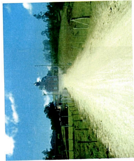
Foto 04 -Igreja Católica de São Tomaz. A esquerda está o campo de futebol e mais acima o salão de bailes