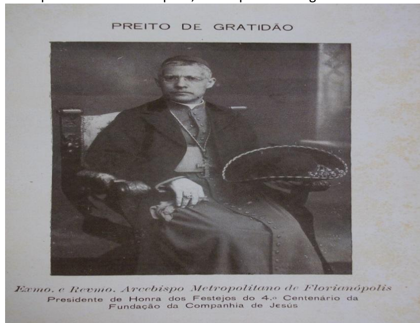
Imagem 6: Demonstração de gratidão para o Exmo.e Revmo. Arcebispo Metropolitano de Florianópolis, D. Joaquim Domingues de Oliveira

Já no âmbito do Ginásio, as reformas essenciais eram dirigidas a passos largos, haja vista a possibilidade e necessidade de transformar o Ginásio em um Colégio, equiparado-o aos moldes do Colégio Pedro II, do Rio de Janeiro, seguindo as premissas do Ministério da Educação. Para tanto, aos auspícios do padre prefeito do Colégio, os ideais jesuítas referenciados na qualidade educacional, bem como na afirmação de sua proposta e colaboração com o progresso e desenvolvimento da sociedade justa e ordeira pretendida por Getúlio Vargas, publicara-se no anuário Relatório de Prefeito 64 do ano de 1940, inicialmente, as fotos do Arcebispo de Florianópolis 65 e do Presidente da República.