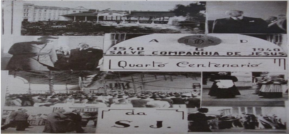
Imagem 8: Celebração do 4º Centenário da criação da Companhia de Jesus

convergir com as exigências do Estado brasileiro, impondo aos jovens as simbologias nacionais.