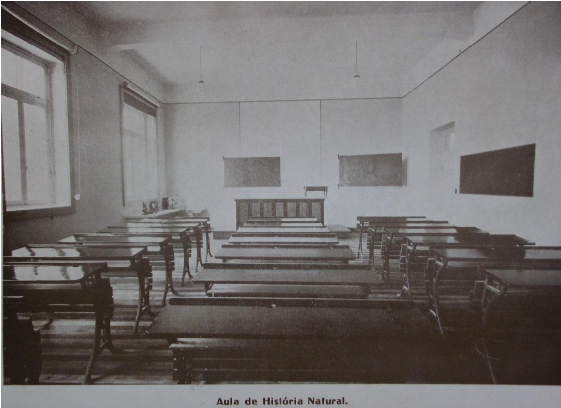
Aula de História Natural.