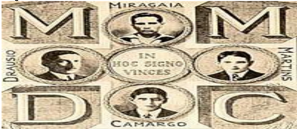
Imagem 1: Os M.M.D.C. de São Paulo