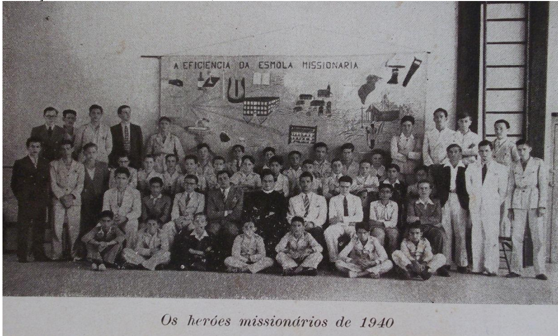
Imagem 10: A homologação do ideal governista e da cúria católica, evidenciada a partir da exaltação dos “heróis missionários”, no ano de 1940

ideal católico, sobretudo, em concordância com o processo político instaurado de então.