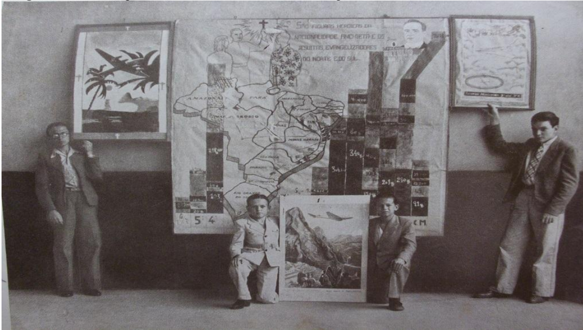
Imagem 3: Homenagem à Pátria e aos Jesuítas - Evangelizadores do Norte ao Sul do País

educandos desta própria instituição fizeram-se presentes, de modo a reafirmar os laços da cúria florianopolitana com o governo.