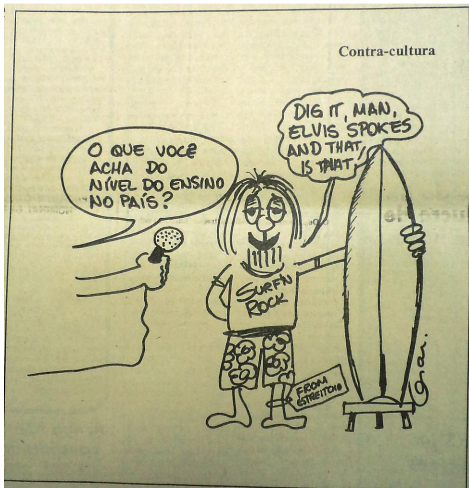
Charge sobre o festival de surf na Praia da Joaquina 101

Fica evidente nos depoimentos que para essas pessoas, tivessem elas participado ativamente do movimento de contracultura ou não, elas não se consideravam alienadas, como implicitamente sugerido pela charge do jornal.