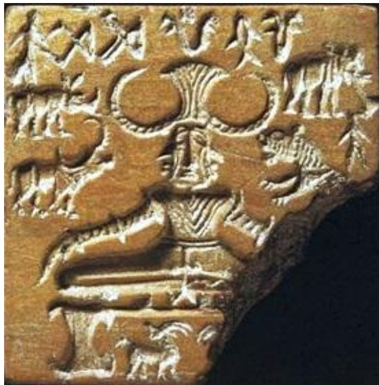
Selo de Pashupati 28

Os mais antigos textos sagrados do Hinduísmo que se tem conhecimento são os Vedas . Apenas quatro destes livros sobreviveram aos nossos dias: o Rig-Veda , que são os hinos em versos de louvor; o Sâma-Veda , composto por cânticos e canções; o Yajur-Veda , que contém as fórmulas sacrificiais e mágicas e o Atharva-Veda , composto por fórmulas rituais de uso geral. Existe muita discordância por parte dos estudiosos, historiadores e arqueólogos, em torno da datação precisa em que foram escritos os Vedas , e é no Rig-Veda que aparecem descrições de práticas de um Proto-Yoga que vão ao encontro de muitos dos achados arqueológicos na região do Indo-Sarasvatî, em especial um selo em terracota em que aparece uma divindade sentada em um trono baixo, em posição de meditação. Este artefato recebeu o nome de selo de Pashupati, e data de aproximadamente 3.000 a.C.