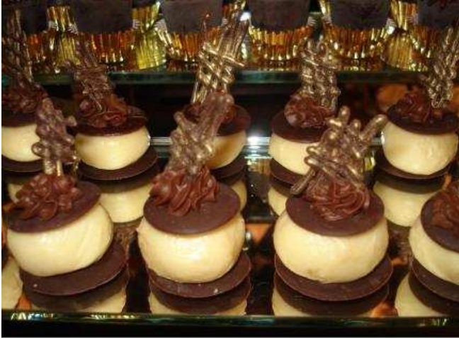
Figura 17: Supreme de maracujá.