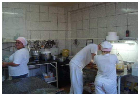
Figura 9: Setor de produção de tortas.