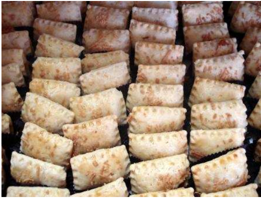
Figura 26: Empanadas.