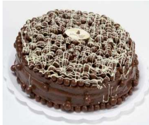
Figura 10: Torta Chocoball.