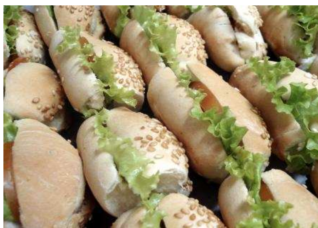
Figura 28: Mini Sanduíche.