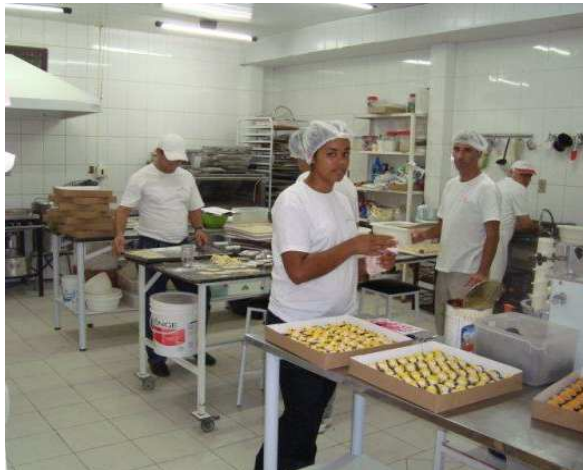
Figura 6: Setor de produção de salgados.