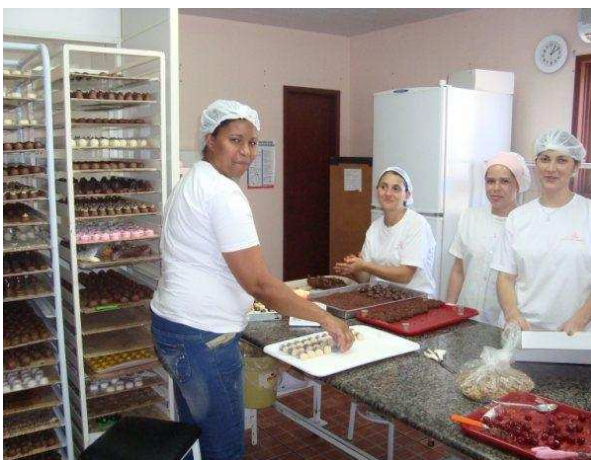
Figura 8: Setor de produção de doces.