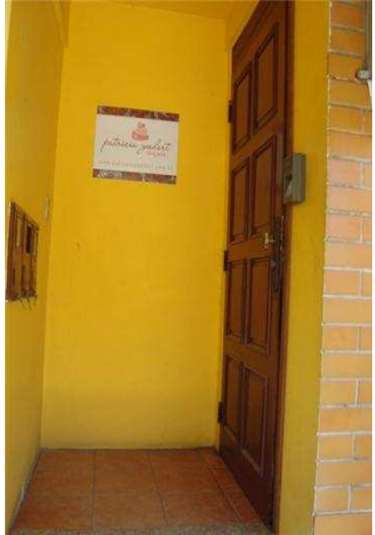
Figura 2: Hall de entrada da Empresa.