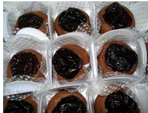
Figura 14: Bombom Primavera de Ameixa.