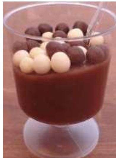
Figura 20: Tacinha de Chocoball.