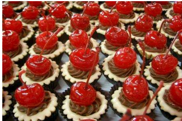
Figura 21: Tartelete de cereja.