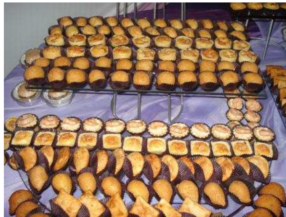
Figura 25: Salgados Simples.