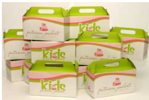
Figura 30: Kit Kids.

Para a realização da encomenda a pessoa tem a opção de ir até a empresa. A empresa é situada em um imóvel de dois andares no bairro Campinas. Apresenta um espaço para o atendimento do público. Patrícia incentiva a visita dos indivíduos na doçaria para que o