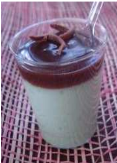
Figura 19: Tacinha de limão.

*Preço: cento e sessenta e cinco reais o cento.