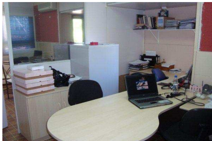
Figura 3: Sala do Sr. Hélio. Fonte: Autora.