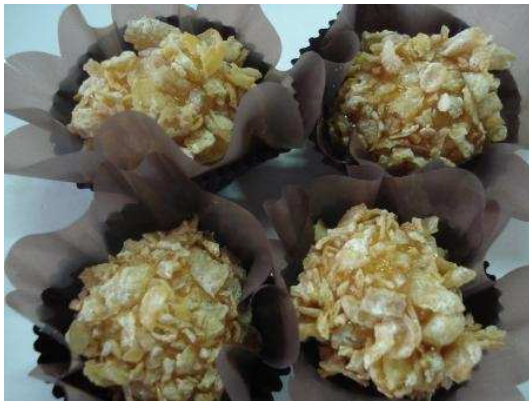
Figura 15: Caramelado Sucrilhos.