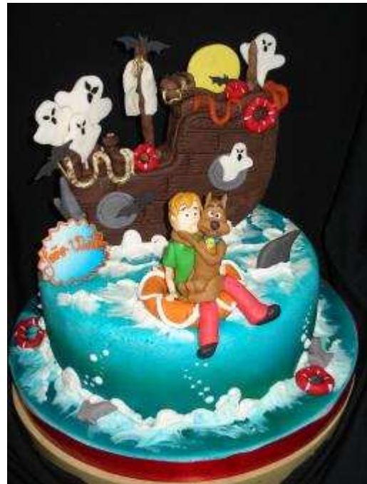
Figura 12: Bolo Infantil.