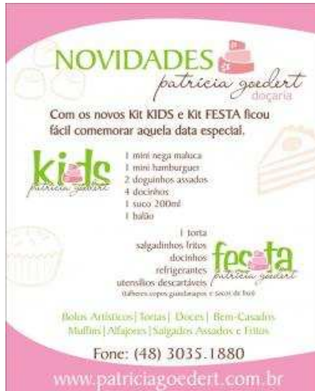
Figura 29: Flyer de divulgação do Kit Kids.

- KIT KIDS: uma lancheirinha com uma mini nega maluca, um mini hambúrguer, dois doguinhos assados, quatro docinhos, um suco de duzentos mililitros e um balão.