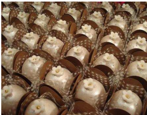
Figura 13: Bombom Pérola de Damasco.