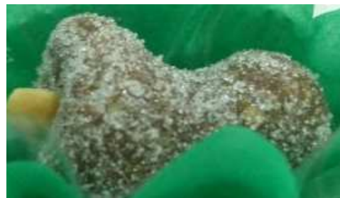
Figura 23: Cajuzinho.