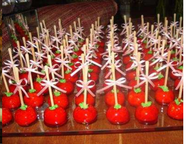
Figura 18: Mini maçã do amor.