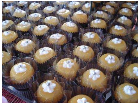
Figura 16: Mini Quindim.