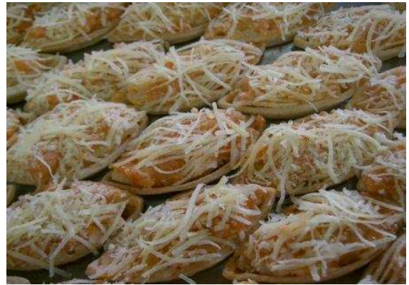
Figura 27: Barquetes.