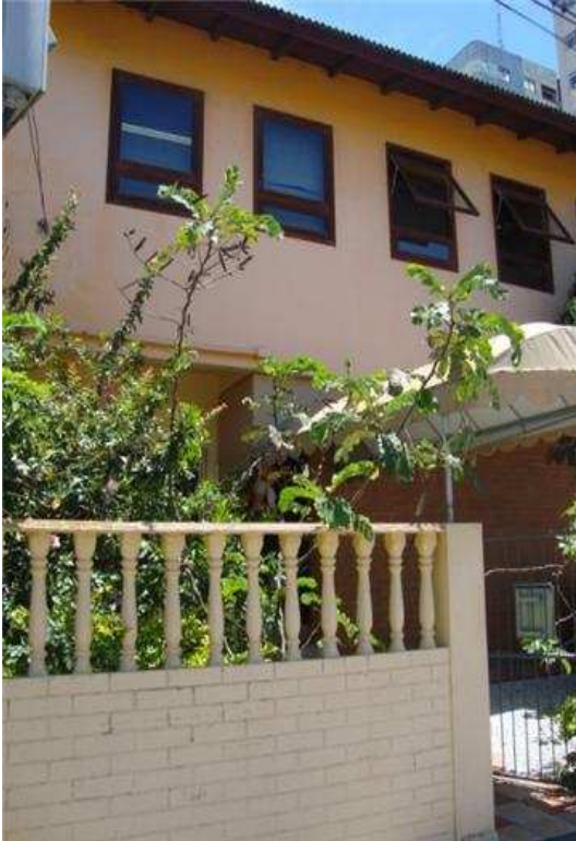
Figura 1: Frente da Empresa.