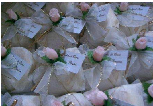
Figura 24: Bem casados.