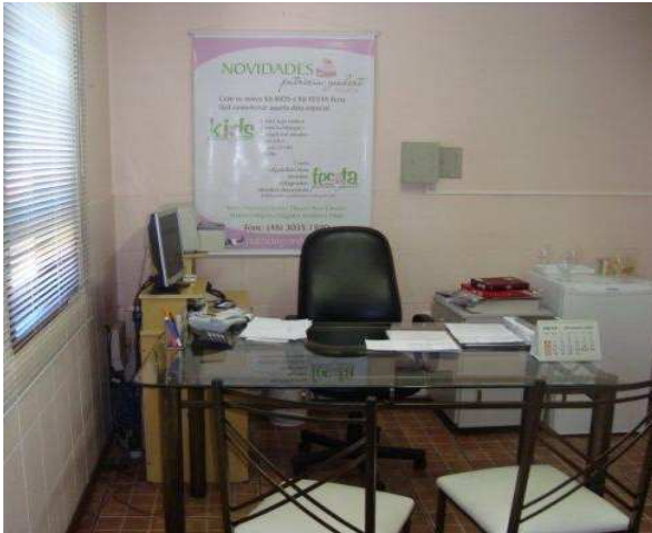
Figura 4: Salada Sra. Patrícia.