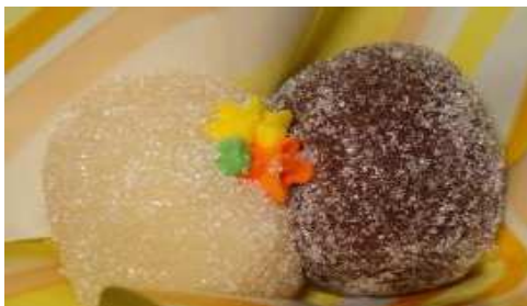
Figura 22: Casadinho.