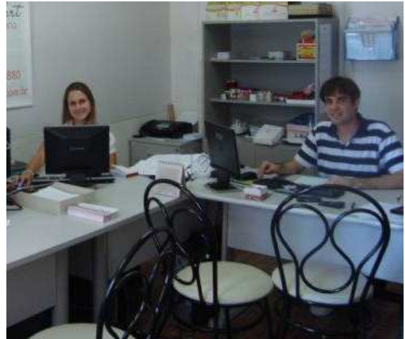
Figura 5: Atendimento aos clientes.