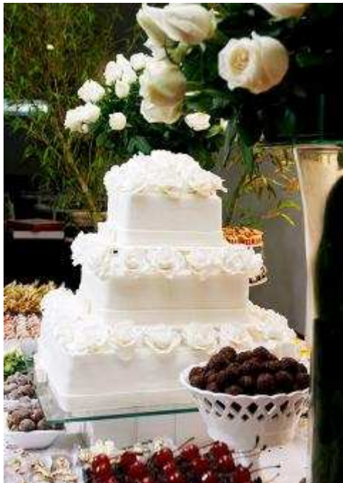
Figura 11: Bolo Casamento.

*Preço: cento e cinquenta reais a duzentos e cinquenta reais.