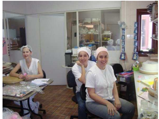
Figura 7: Setor artístico.