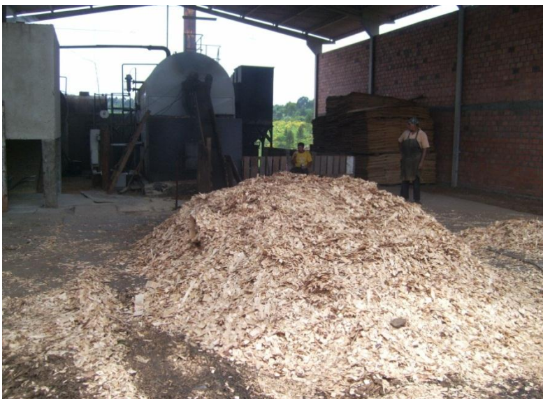
Figura 2. Caldeira onde é gerado o vapor para o cozimento da torra e secagem das madeiras.