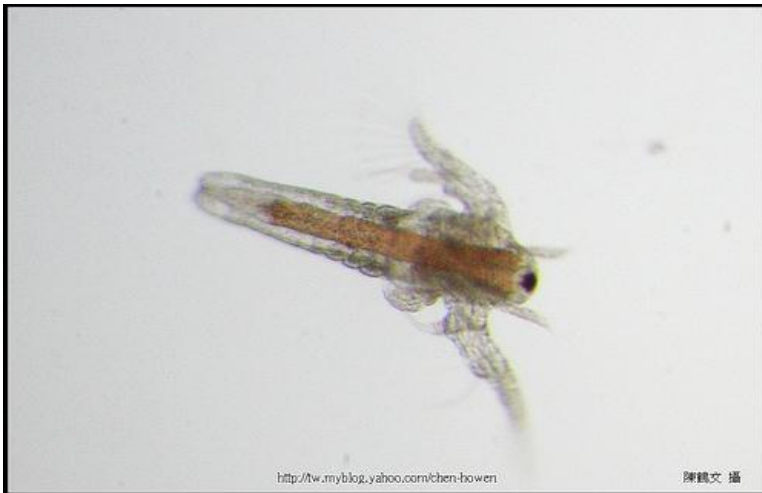
Figura 6. Náupilo de Artemia sp. após eclosão.