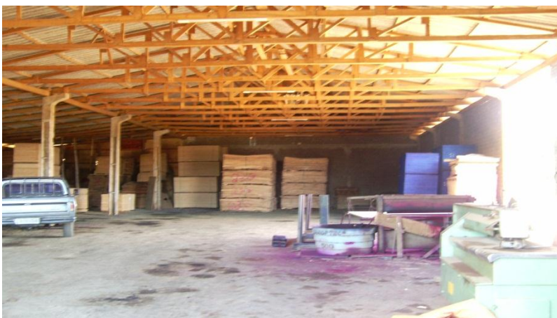
Figura 4. Rolo de pintura de compensado utilizando anilina como corante.