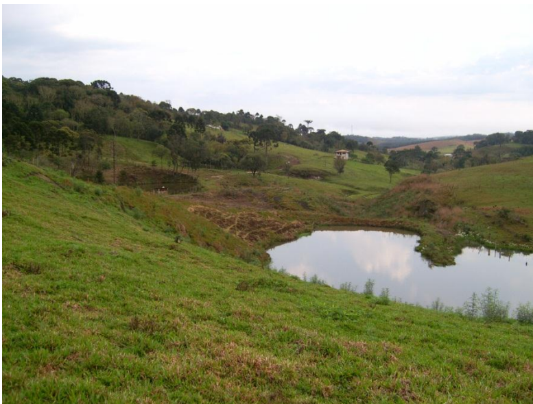
Figura 1. Efluente próximo a empresa, porém antes de passar nas dependências da mesma.