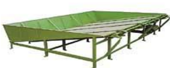
Figura 5. Equipamento onde a madeira serrada é banhada com anti-mofo, para que não azule.