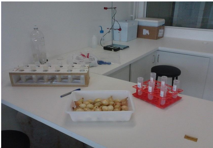
Figura 7. Cebolas sendo expostas as amostras em tubos falcon.