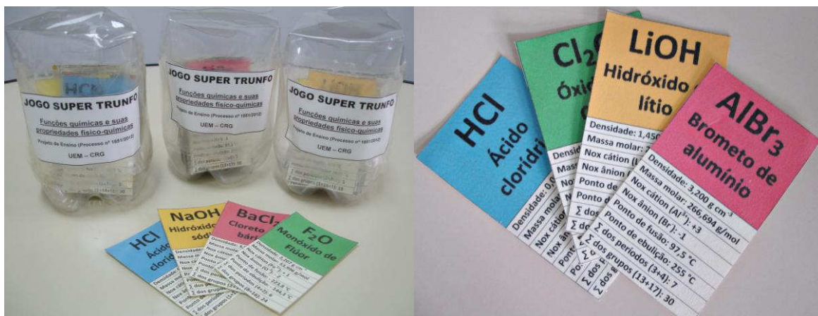
Figura 01 Jogos didáticos “Super Trunfo das Funções Químicas”.