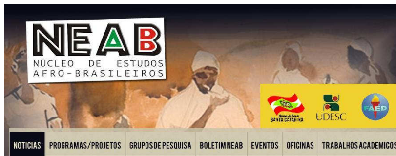
Figura 2: Home do site do NEAB ( http://www.neab.faed.udesc.br/ ).

Este ano, o Núcleo de Estudos Afro-Brasileiros da UDESC, organizou dois eventos muito importantes sobre a temática afro-brasileira. O VII Congresso Brasileiro de Pesquisadores/as Negros/as e o II Encontro Estadual do GT Estudos Africanos e da Diáspora . O primeiro, realizado entre os dias 16 e 20 de julho, teve como tema Os desafios da luta antirracista do século XXI e reuniu cerca de 1.000 participantes, entre pesquisadores/as nacionais e internacionais, acadêmicos/as e ouvintes. O segundo, realizado entre os dias 19 e 22 de agosto, teve como tema Tempo, memórias e expectativas: conexões atlânticas , tendo como participantes pesquisadores/as da temática em Santa Catarina.