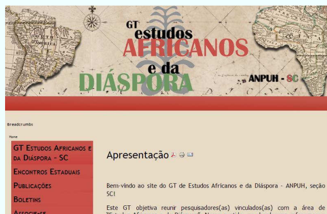
Figura 3: Home do site do GT Estudos Africanos e da Diáspora ( http://www.africadiaspora.faed.udesc.br/ ), também criado este ano.

Este ano, o Núcleo de Estudos Afro-Brasileiros da UDESC, organizou dois eventos muito importantes sobre a temática afro-brasileira. O VII Congresso Brasileiro de Pesquisadores/as Negros/as e o II Encontro Estadual do GT Estudos Africanos e da Diáspora . O primeiro, realizado entre os dias 16 e 20 de julho, teve como tema Os desafios da luta antirracista do século XXI e reuniu cerca de 1.000 participantes, entre pesquisadores/as nacionais e internacionais, acadêmicos/as e ouvintes. O segundo, realizado entre os dias 19 e 22 de agosto, teve como tema Tempo, memórias e expectativas: conexões atlânticas , tendo como participantes pesquisadores/as da temática em Santa Catarina.