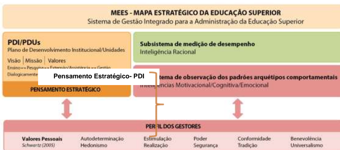
Figura 3–Modelagem de diagnóstico da consolidação do PDI na Administração da Educação Superior: Desenho considerando o MEES

comportamentais no processo de consolidação do MEES. A Figura 3 apresenta a arquitetura da modelagem proposta.