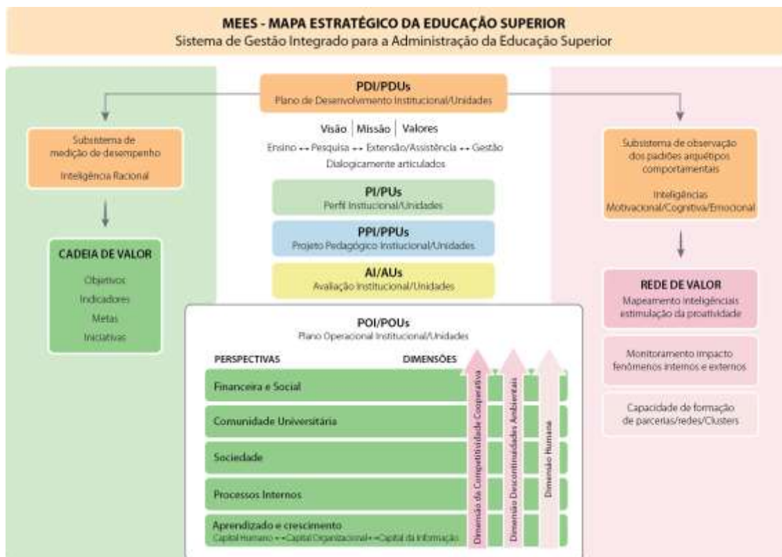
Figura 02 – Arquitetura do MEES: plano estratégico operacional do PDI fundamentado na abordagem quântica