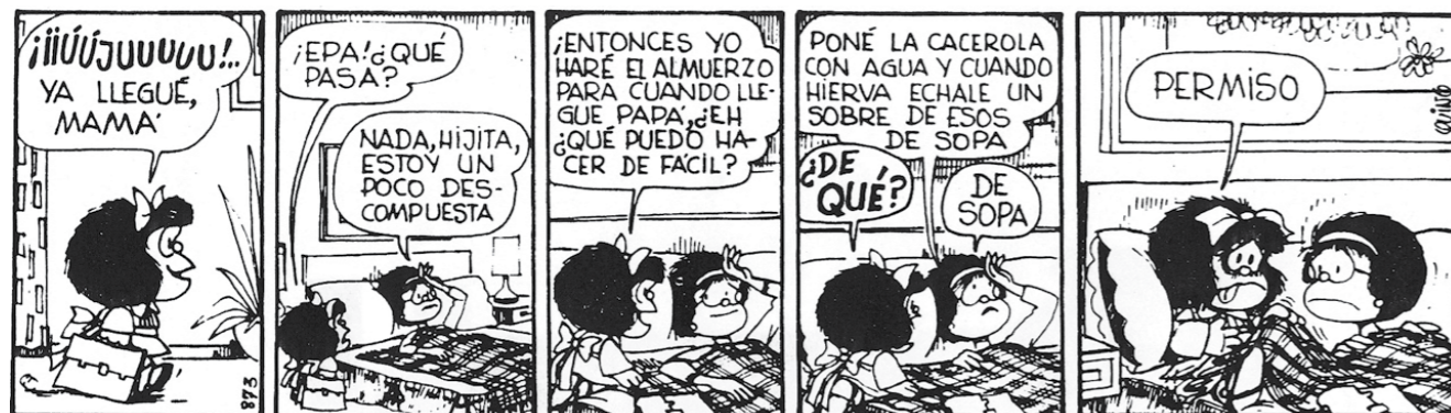
(Quino. 1973. 10 años de Mafalda. Barcelona, Editorial Lumen, 10 ed., p. 87.)

Traemos a continuación una de las tiras de Mafalda sobre el tema de la sopa: