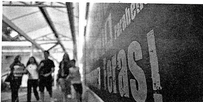
Colégio Bom Jesus Santo Antônio teve pelo segundo ano consecutivo a maior média entre as escolas de SC