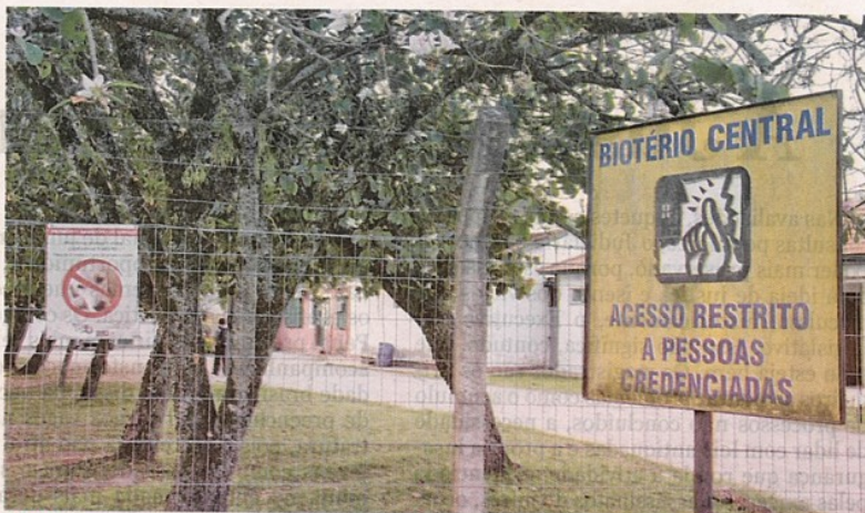
Biotério. Por causa do movimento, funcionários da UFSC foram orientados a tomar cuidado com invasões ao local

Entre os contrários ao protesto está um farmacêutico que fez pesquisas com cachorros, ele preferiu não se identificar. “Eu acredito na redução do número de animais na pesquisa. Não precisa haver protesto, pois todos profissionais de áreas biomédicas têm consciência de que ninguém tem prazer em trabalhar com animais. Mas eles são importantes para os testes”, falou.