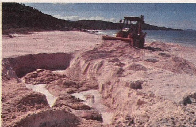
Na praia. Baleia apareceu morta na última quinta-feira na Armação

A baleia de mais de nove metros e aproximadamente oito toneladas foi enterrada na praia onde encalhou. De acordo com pescadores, ela estava morta e boiando próxima à Ilha do Amendoim, também chama-