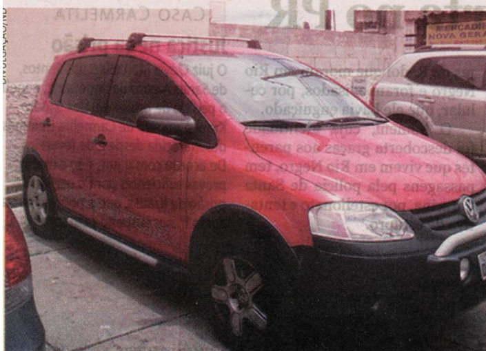
Cross Fox. Estudante de economia teve o carro roubado na saída da UFSC

Apesar dos registros da última madrugada, delegado diz que casos diminuíram