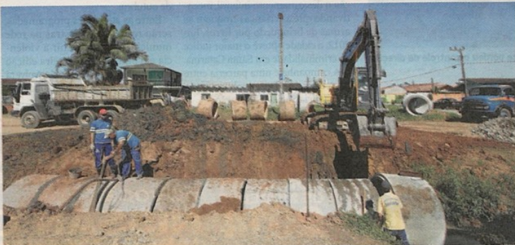
Terreno teria custado R$ 2,6 milhões a mais do que o valor de mercado segundo o Ministério Público Federal

O MPF aponta superfaturamento de R$ 2,6 milhões na negociação da área. Uma perícia pedida pelo órgão