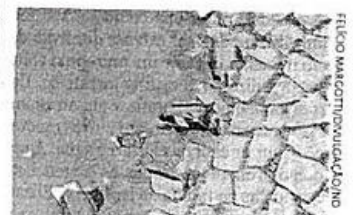
UFSC pós-festas. Professor tem um banco de imagens sobre o dia seguinte das muitas festas realizadas dentro da universidade