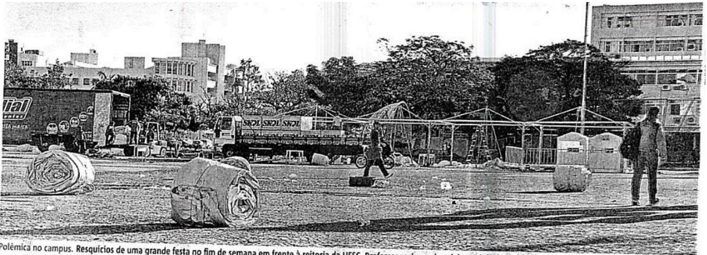
Polêmica no campus. Resquícios de uma grande festa no fim de semana em frente à reitoria da UFSC. Professor reclama de sujeira e violência, enquanto para aluno eventos têm função cultural