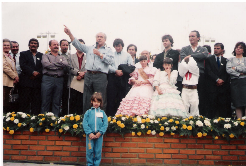
Fotografia 3: Foto do discurso de Leonel Brizola no ato da inauguração do CIEP Rodesindo Pavan

Leonel Brizola compareceu à inauguração, conforme pode ser visto nas fotografias 1 e 2.