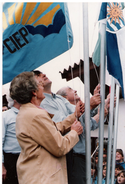
Fotografia 1: Foto da inauguração do CIEP Rodesindo Pavan

Abelardo, número 400, Bairro Vila Real, região oeste do município de Camboriú, próximo à rodovia BR 101.