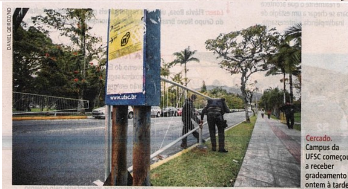
Cercado. Campus da UFSC começou a receber gradeamento ontem à tarde

gundo Oliveira, é que os portões fiquem fechados diariamente entre 23h e 6h e entre 23h de sexta-feira e 6h de segunda-feira. Também devem ser instaladas três guaritas. Segundo a reitoria, a medida não vai interferir na circulação do transporte coletivo e dos carros, e de quem anda a pé ou de bicicleta. (Maurício Frighetto)