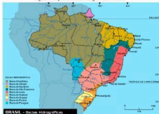
Figura 1. Mapa das bacias hidrográficas do Brasil.