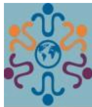
Figura 2. Reunião.