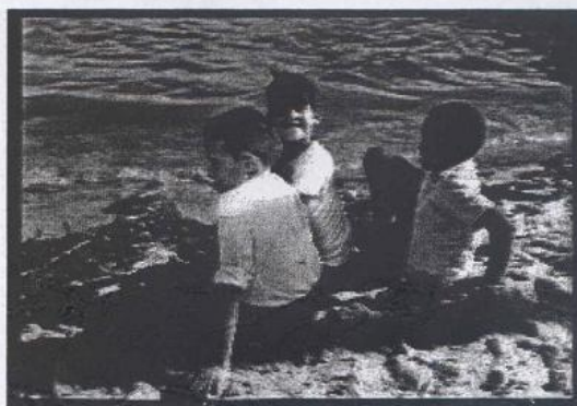
Catarinense. "O Preço da Ilusão" traz cenas de Florianópolis antigamente