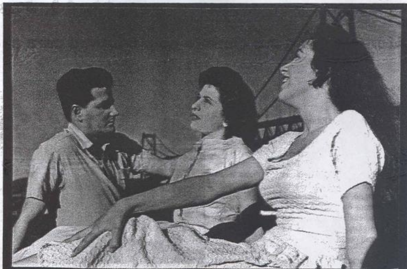
Filmes. O longa "O Preço da Ilusão" (1957) é mencionado em documentário de Carreirão, que pode ser visto na mostra

Será possível também assistir a filmes em uma sala especial, mediante agendamento